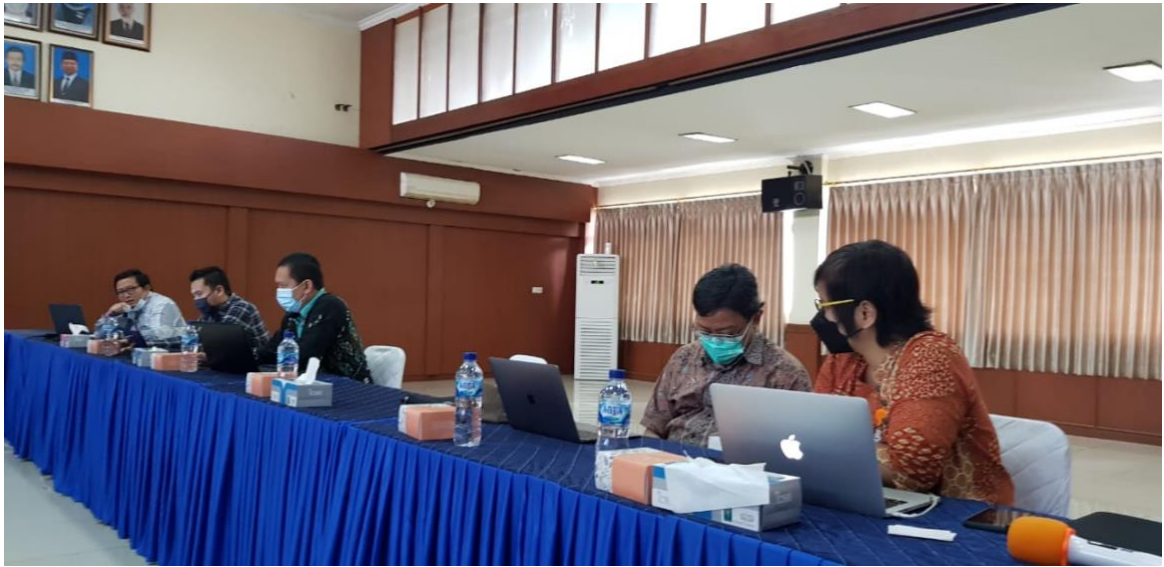
Daftar hadir rapat koordinasi pembahasan analisis mengenai website LLDIKTI IV tanggal 9 Februari 2021 dan brainstorming mengenai perancangan video profil LLDIKTI IV bersama tim pengembang website dari LLDIKTI IV dan Itenas.