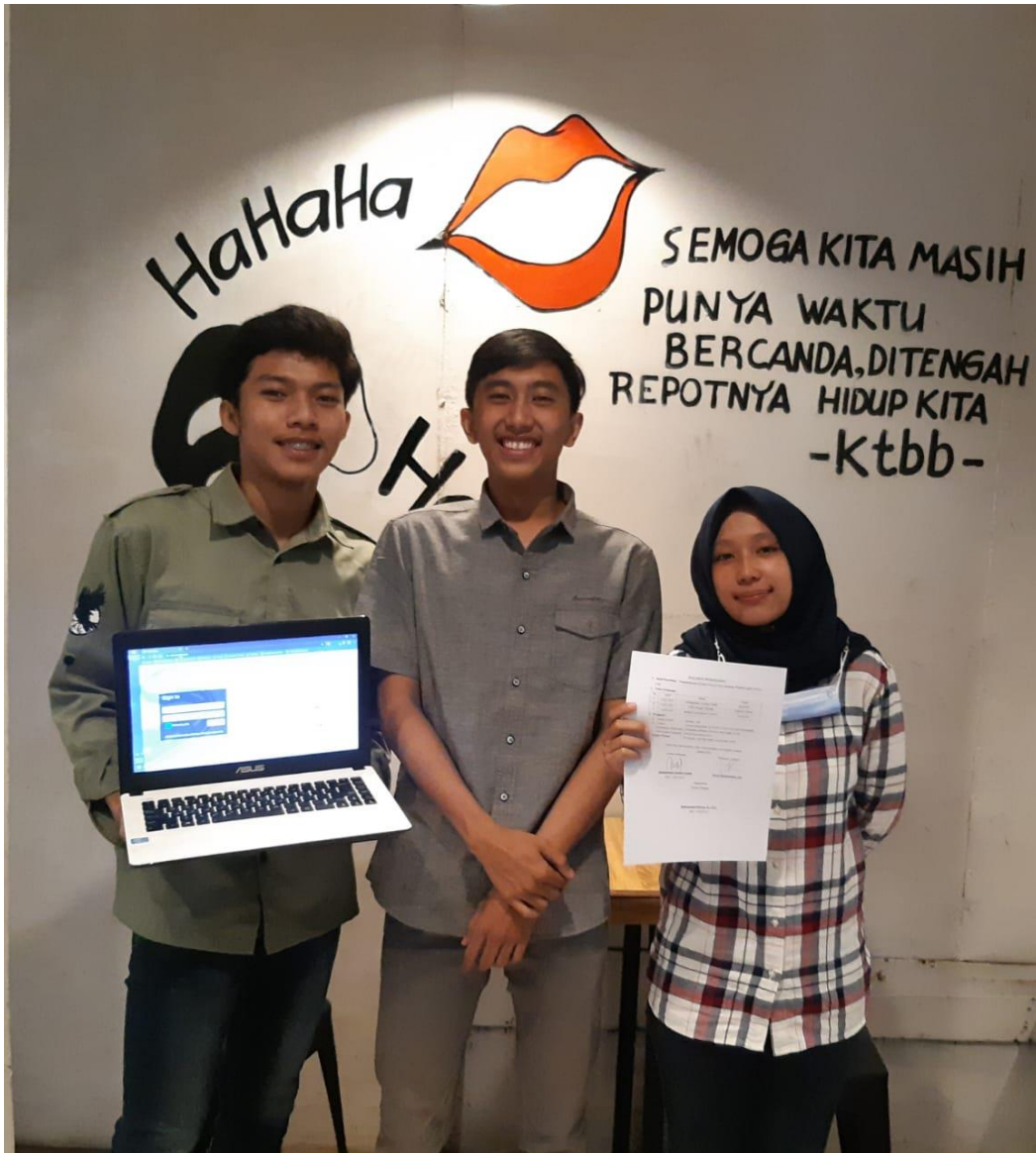
FOTO KEGIATAN DAN LOKASI INHOME CAFE