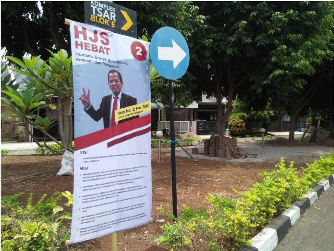
Gambar 7. Hasil Cetak Desain Banner Kampanye Yang Telah Terpasang Pada Area 3 (Taman Area Belakang Kompleks Perumahan TSAR)

Proses pemilihan koordinator dilakukan secara langsung oleh warga pada hari Minggu 28 Februari 2021 bertempat di area halaman Mesjid Nurul Huda kompleks perumahan TSAR. Proses pemilihan dimulai dari pukul 08.00 – 12.00 WIB. Kegiatan penghitungan suara dilakukan pada pukul 13.00 WIB.