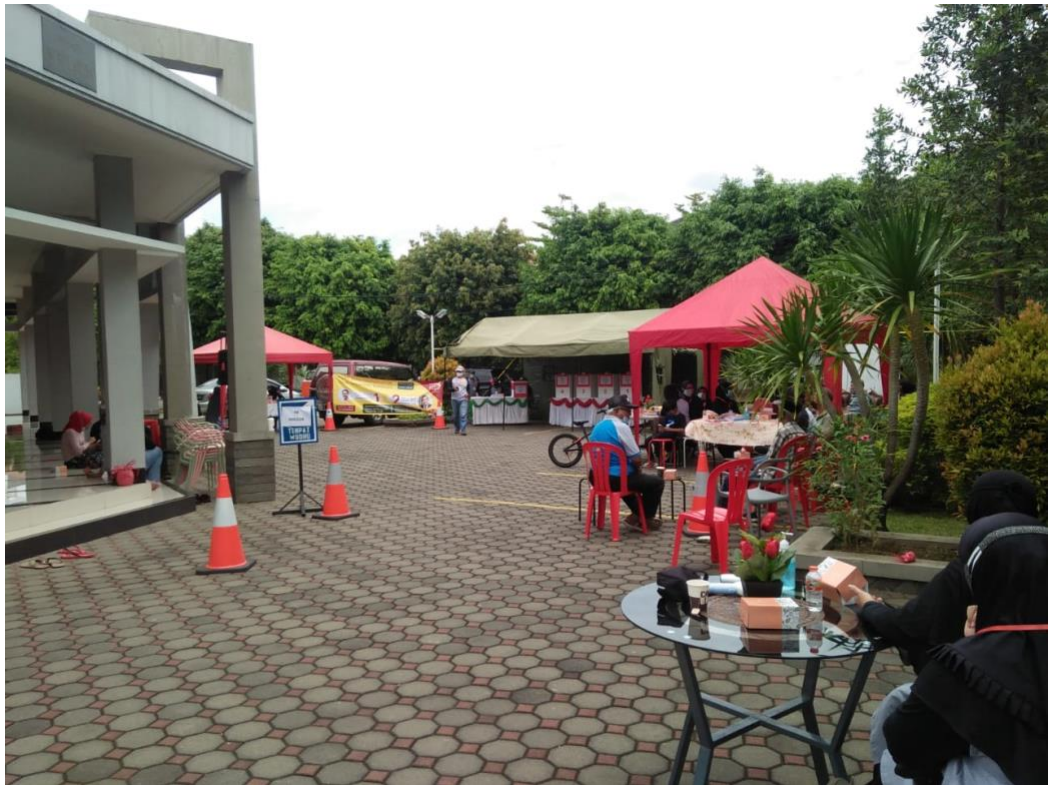
Gambar 10. Proses Pelaksanaan Kegiatan Pemilihan Koordinator Kompleks Perumahan TSAR (Minggu 28 Februari 2021)