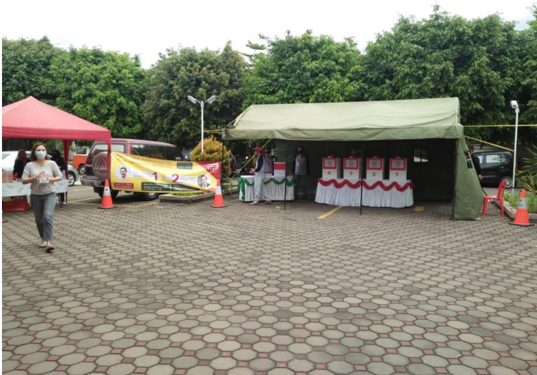
Gambar 9. Proses Pelaksanaan Kegiatan Pemilihan Koordinator Kompleks Perumahan TSAR (Minggu 28 Februari 2021)