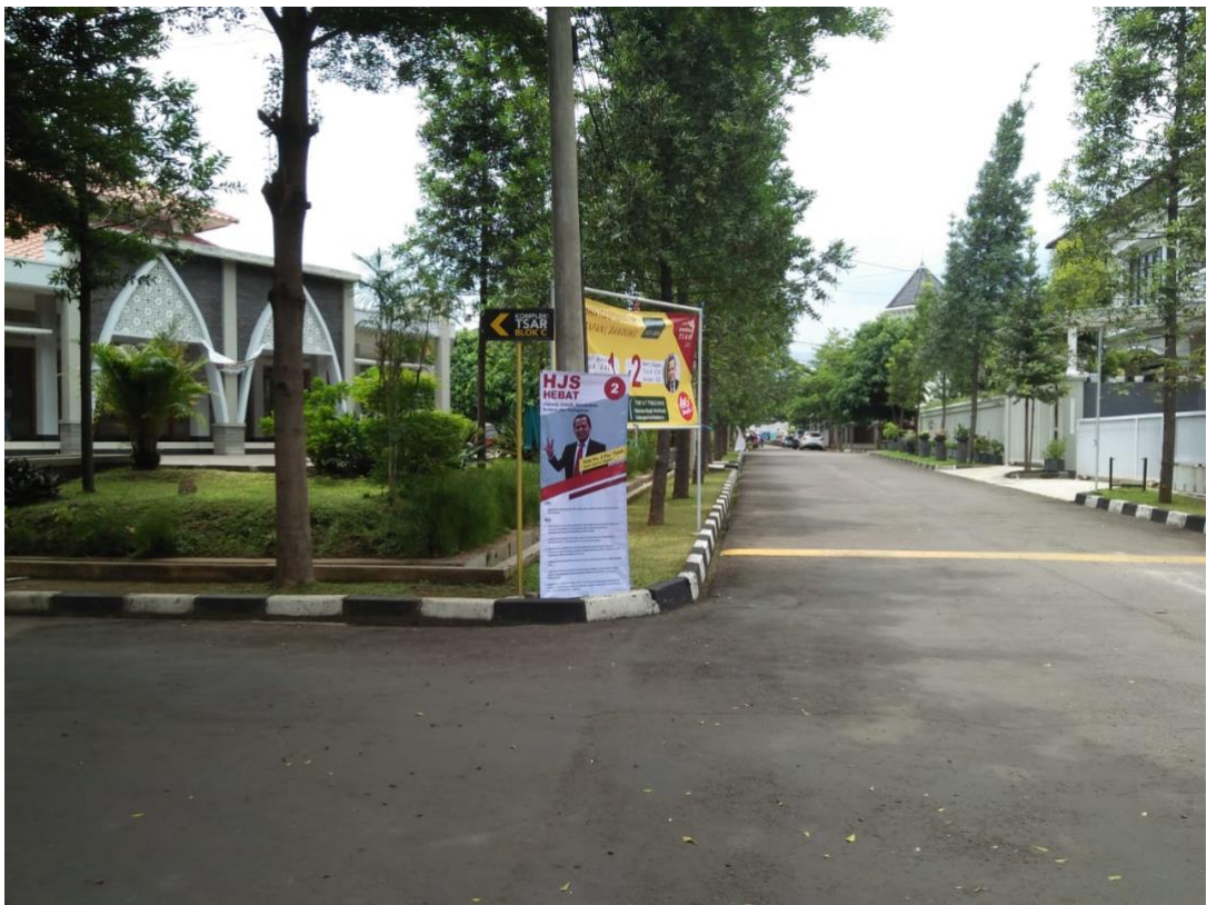
Gambar 6. Hasil Cetak Desain Banner Kampanye Yang Telah Terpasang Pada Area 2 (Area Tengah Kompleks Perumahan TSAR Sekitar Mesjid)