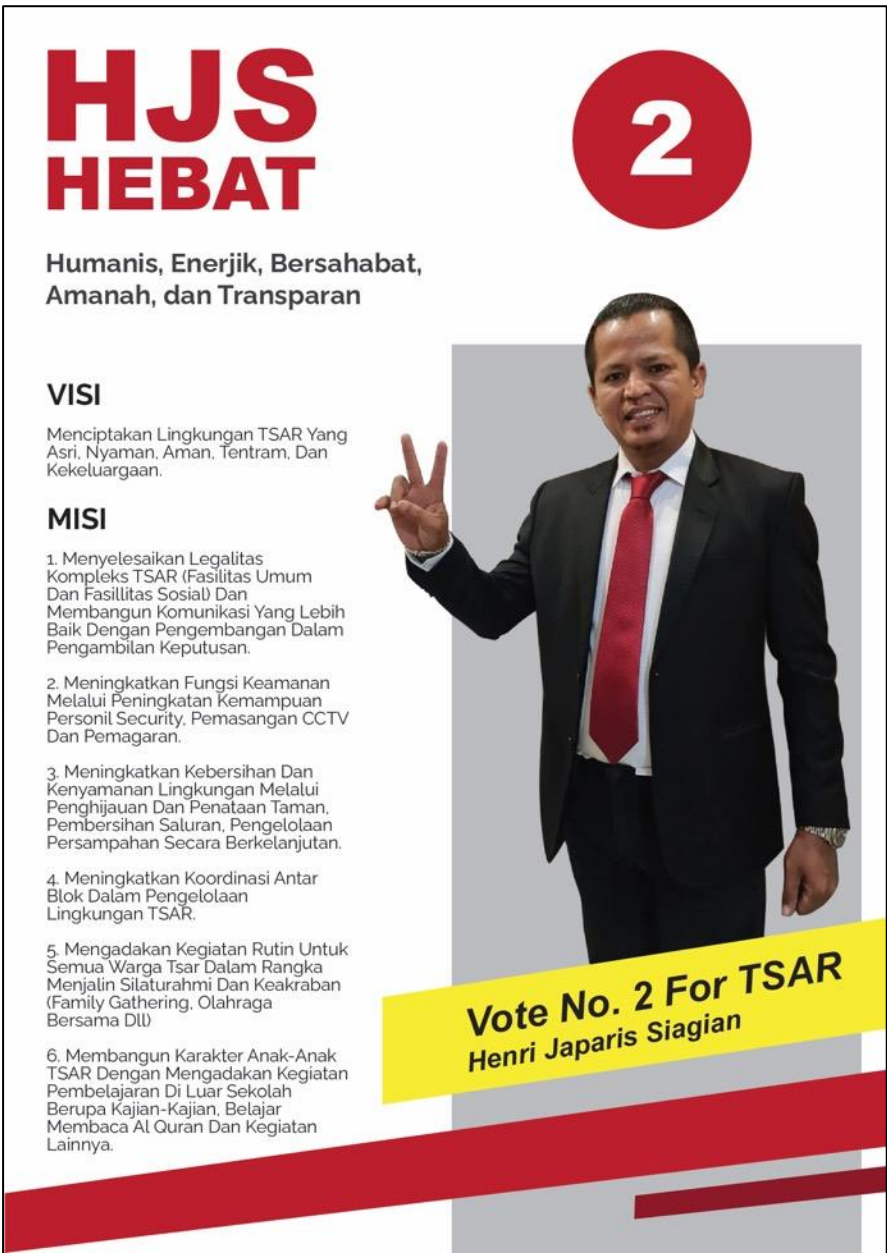
Gambar 4. Hasil Perancangan Desain Flyer Kampanye Berukuran 21 cm x 29.7 cm

Sehubungan dengan Bapak Henri Siagian akan melakukan kampanye selama satu hari melalui media Whatsapp Messenger (WA) pada grup WA setiap blok kompleks perumahan, penulis pun memberikan perancangan desain ekstra yang bisa digunakan dengan ukuran yang sesuai untuk kampanye. Hasil perancangan desain flyer digital berukuran 21 cm x 29.7 cm bisa dilihat seperti berikut ini :