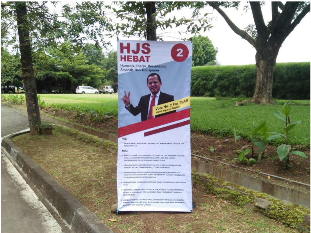
Gambar 5. Hasil Cetak Desain Banner Kampanye Yang Telah Terpasang Pada Area 1 (Pintu Masuk Kompleks Perumahan TSAR)

Hasil cetak desain banner kampanye nomor urut 2 diaplikasikan dengan cara memasangnya pada setiap persimpangan jalan di kompleks perumahan TSAR. Proses pemasangan dilakukan oleh tim sukses calon nomor urut 2. Berikut ini adalah visual foto berdasarkan hasil proses dokumentasi penulis secara langsung di lapangan :