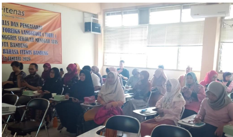
Gambar 1: Peserta mengikuti pelatihan dengan antusias

Selama kegiatan, kami melihat antusiasme para guru yang terlibat aktif dengan bertanya, mengerjakan tugas yang diberikan oleh instruktur, dan membagikan hasil pemikiran pribadi atau kelompoknya tanpa diminta. Hal ini tentu saja merupakan indikasi bahwa para guru tersebut mengikuti kegiatan dengan bersemangat. Kami menganggap ini adalah salah satu indikator keberhasilan kegiatan ini.