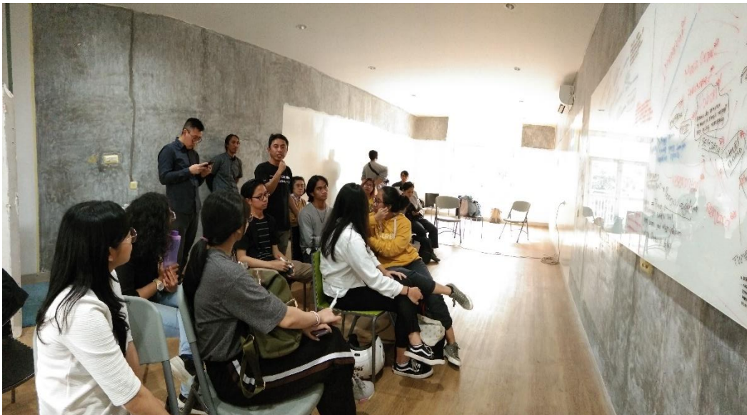
Uji coba workshop dan diskusi tentang designing Porto folio dan Personal Branding, diikuti oleh dosen dan mahasiswa dari Itenas, ITHB, Universitas Maranatha dan STDI