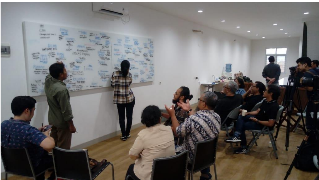
Ujicoba Workshop dan diskusi mengenai citra, obyek, konsep dan Idea diikuti oleh para dosen dari 6 Perguruan Tinggi di Bandung, Januari 2020

Setelah matang selama 8 Bulan persiapan, workshop diujicobakan sejak Bulan Januari 2020 dengan mengumpulkan dosen dan mahasiswa serta pengusaha dari berbagai perguruan tinggi di Bandung. Berikut adalah foto kegiatan workshop yang diselenggarakan: