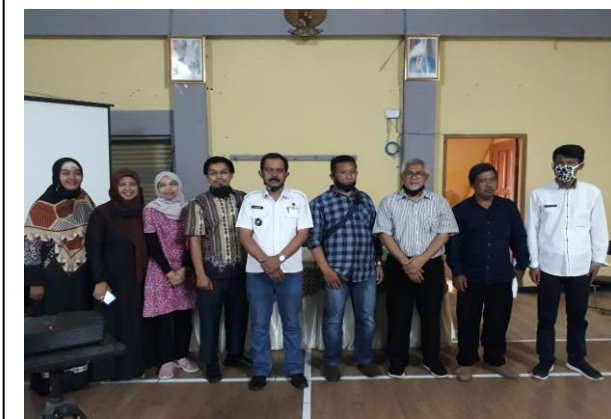
Tim pengabdian masyarakat berfoto bersama Kepala Desa dan jajarannya