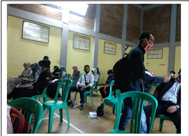
Antusias warga mengikuti kegiatan dengan kehadirannya di acara pelatihan