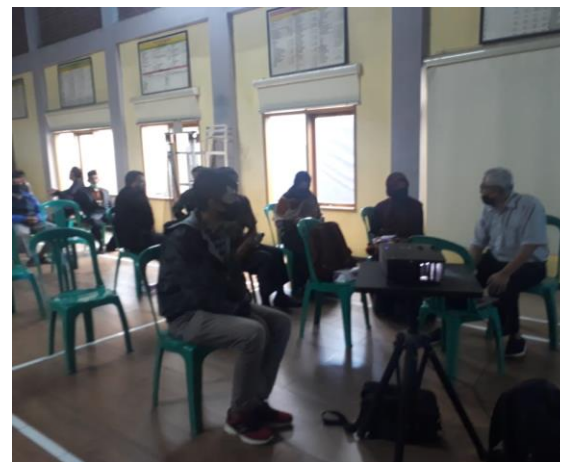
Diskusi dengan peserta pelatihan mengenai pengisian data