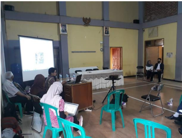
Presentasi tujuan pelatihan di Balai Desa Mekarsaluyu