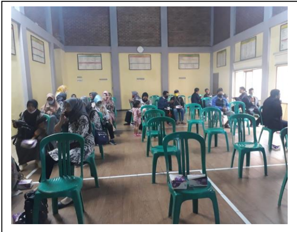
Suasana ruang dalam pelatihan di balai desa Mekarsaluyu