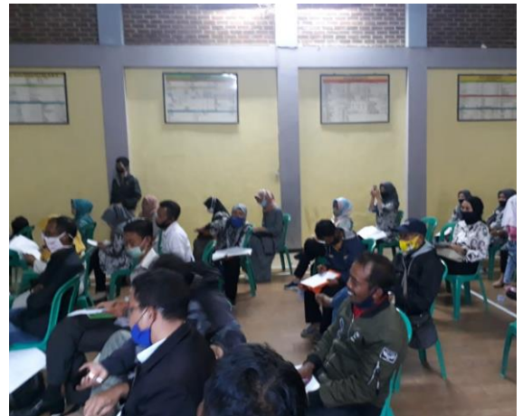
Peserta pelatihan terdiri dari warga desa perwakilan RT dan kelompok kegiatan desa