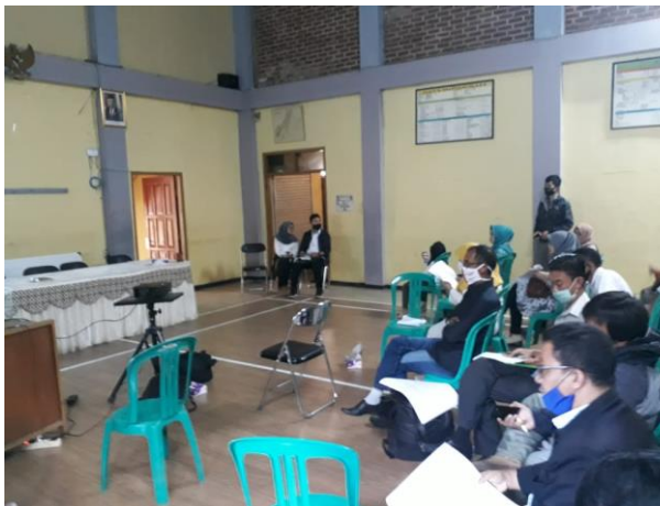
Peserta pelatihan sedang mendengarkan penjelasan tatacara pengisian data