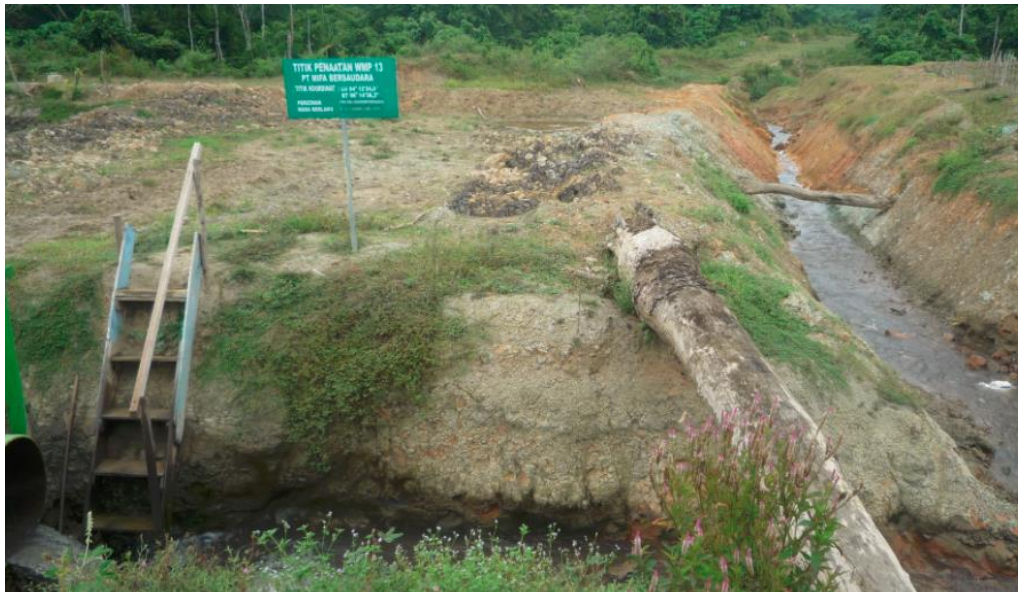
Pemeriksaan saluran pembuangan air dari kegiatan penambangan