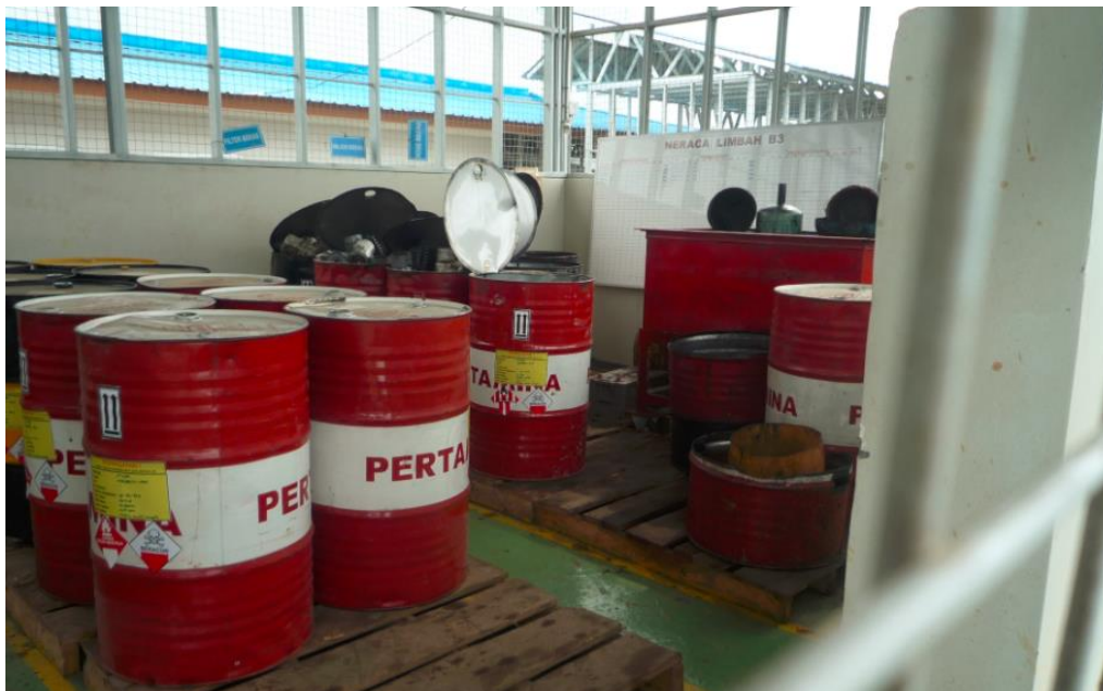
Pemeriksaan TPS Limbah B3