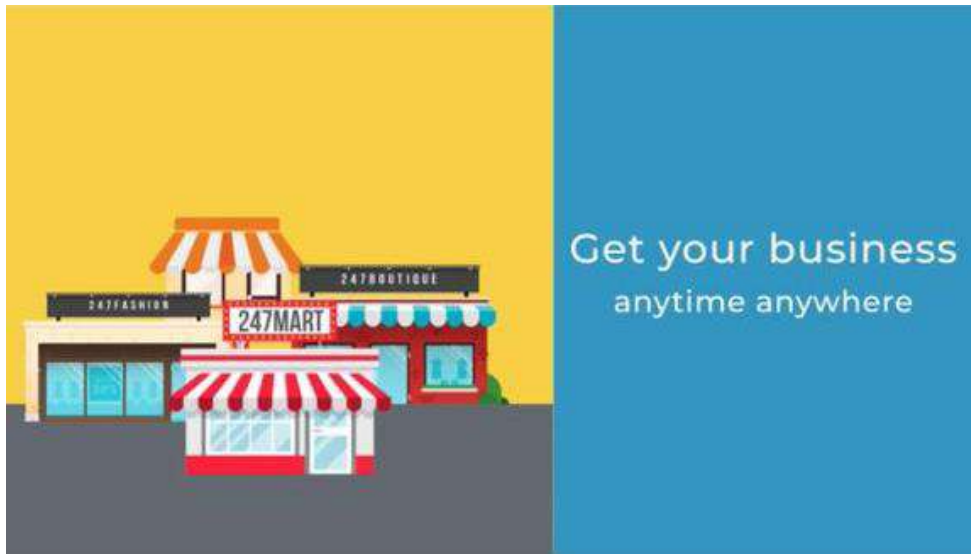
Gambar 1. Konten video promosi: Kemudahan menjalankan bisnis