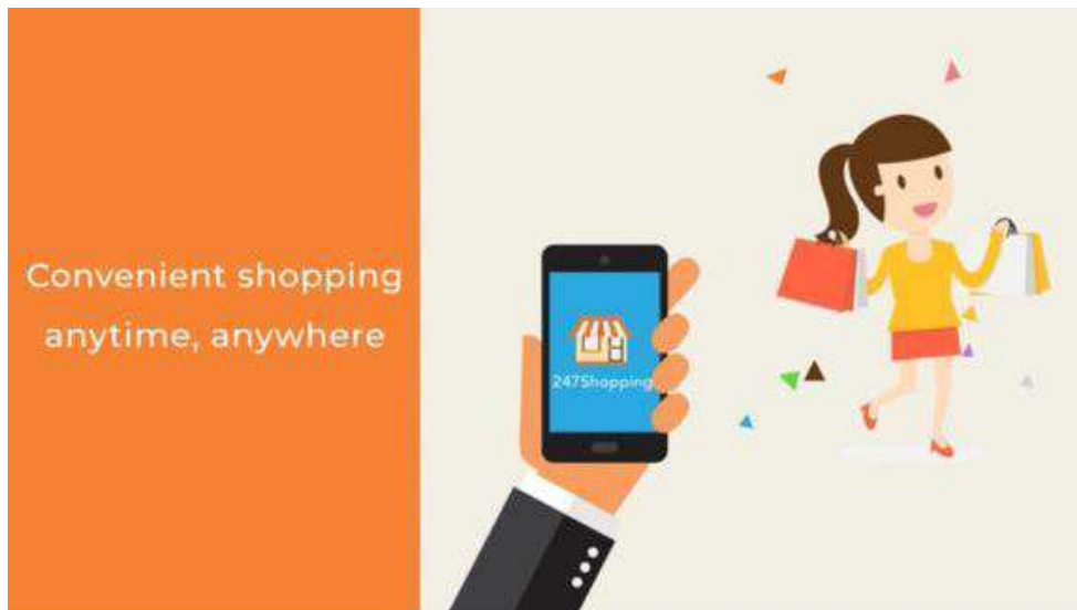
Gambar 3. Konten video promosi: Kemudahan berbelanja

Selain video promosi, pada tahap pertama ini dihasilkan desain poster untuk dipublikasikan pada instagram, facebook dan whatsapp ditunjukan pada gambar 4 sampai gambar 6.