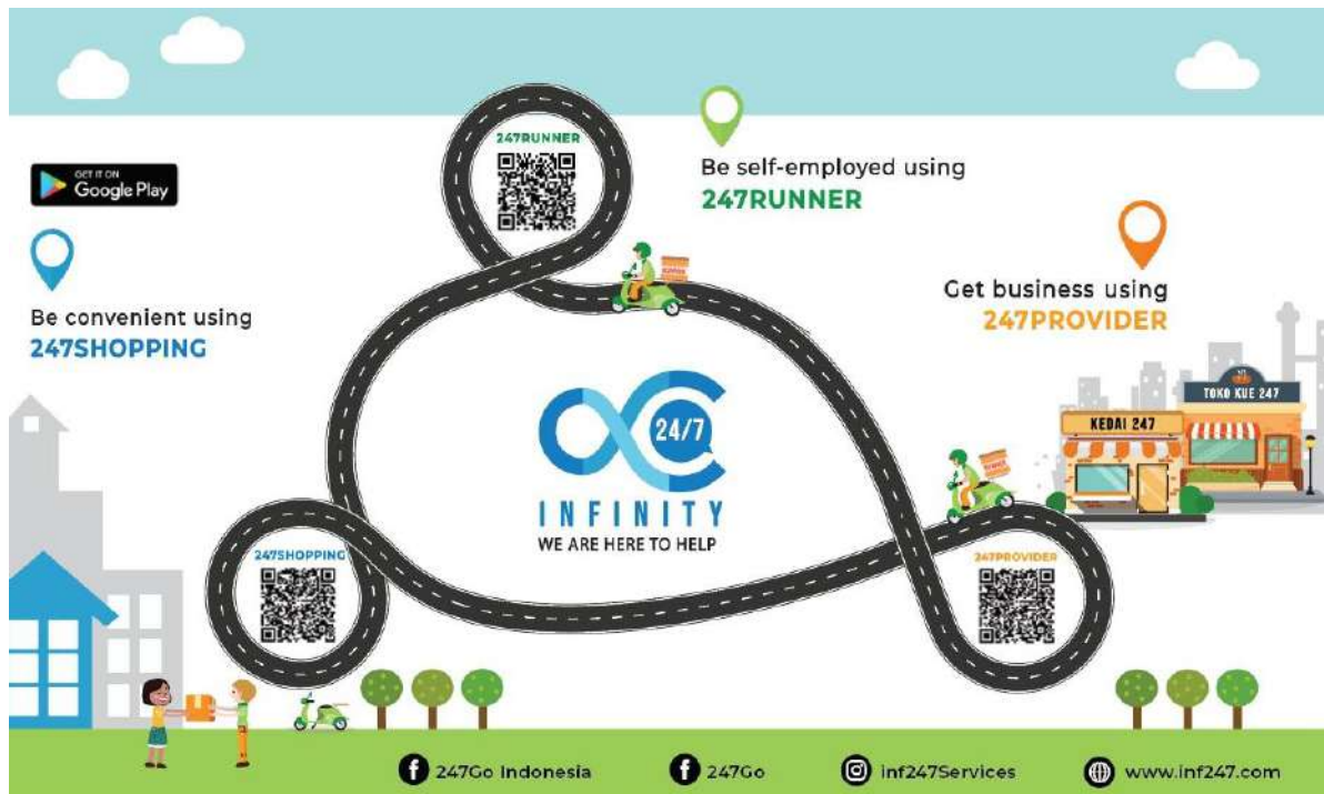
Gambar 9. Media promosi cetak untuk Stiker