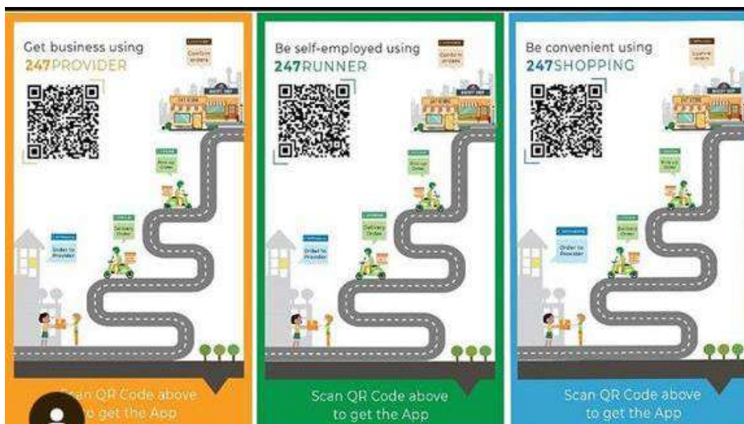
Gambar 4. Media promosi untuk mengenalkan produk dari CV Infinity Karya Bersama

Selain video promosi, pada tahap pertama ini dihasilkan desain poster untuk dipublikasikan pada instagram, facebook dan whatsapp ditunjukan pada gambar 4 sampai gambar 6.