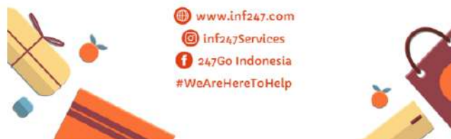
Gambar 8. Media promosi cetak untuk Roll-Banner