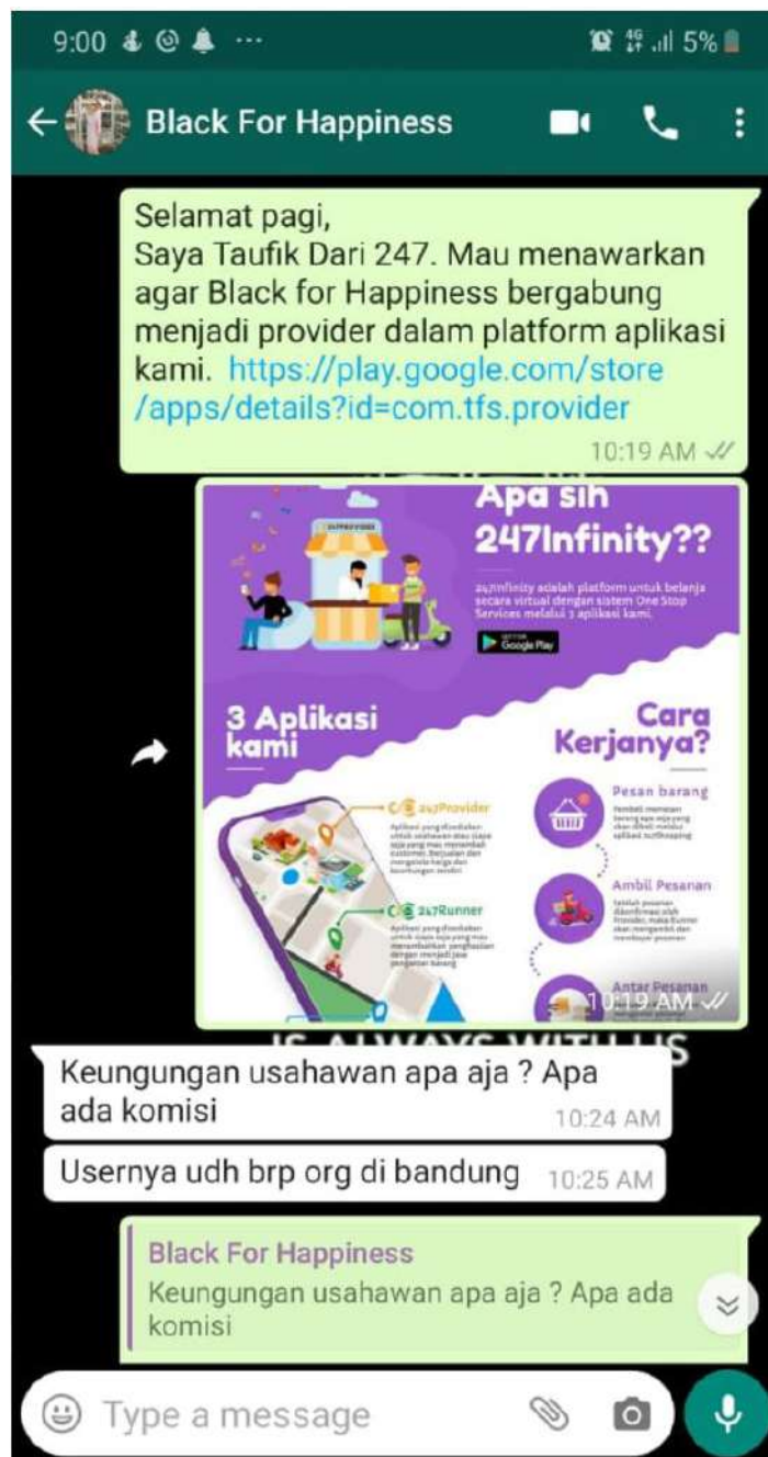
Gambar 6. Broadcast menggunakan media promosi digital

pemilik UMKM yang ada di Bandung. Hasil komunikasi pemasaran ini diperoleh respon yang bervariasi dari pedagang, diantaranya respon positif dimana pedagang bertanya lebih lanjut mengenai produk dari Infinity Karya Bersama yaitu 247Provider. Ada juga yang langsung mengunduh dan registrasi pada aplikasi tersebut. Salah satu respon penjual dapat dilihat pada gambar 6.