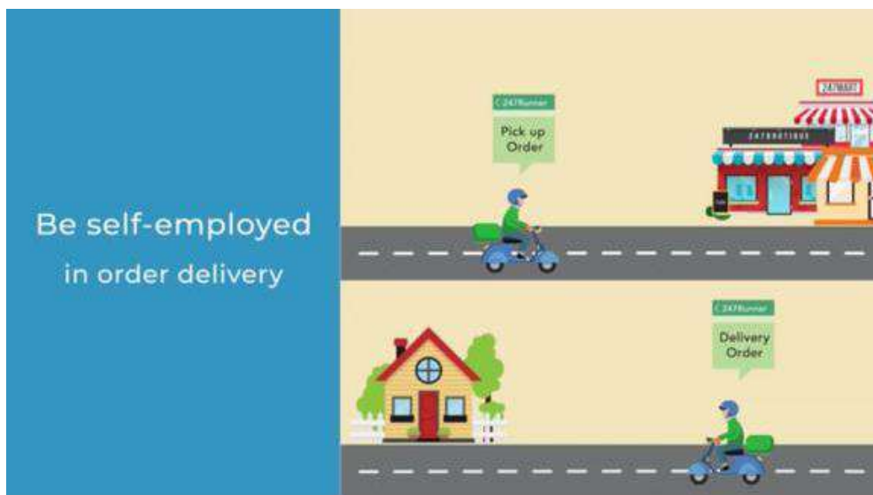
Gambar 2. Konten video promosi: Menjadi jasa kurir