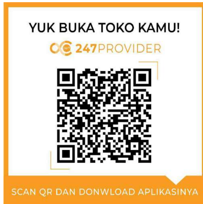
Gambar 7. Media promosi untuk mengajak pelaku bisnis bergabung di aplikasi 247Provider

Media promosi pada Gambar 7 diperuntukkan bagi pedagang yang ingin bergabung di aplikasi 247Provider. Kode QR pada poster ini untuk mengakses link download aplikasi pada Google Play Store. Adapun deliverable tahap dua adalah media promosi untuk dicetak yang dapat membantu komunikasi pemasaran tim marketing. Diantaranya adalah desain promosi untuk Roll-Banner dan Stiker. Hasil desain ditunjukkan pada gambar 8 dan gambar 9.