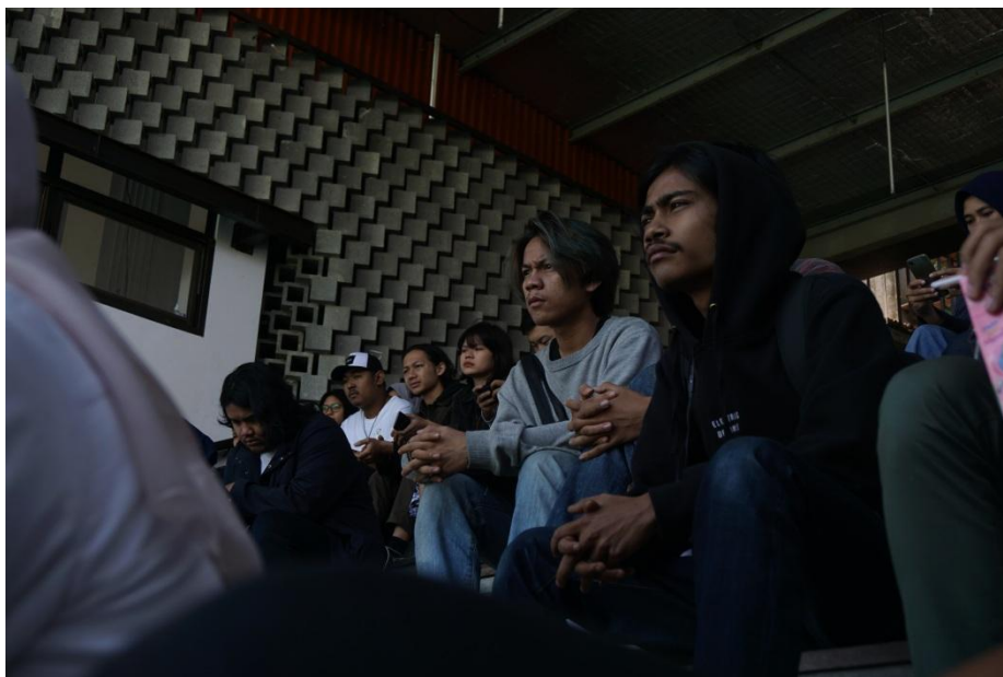
Gambar 1. Suasana Designer Talks

Kegiatan ini merupakan respon Jurusan Desain Interior terhadap permohonan Mitra untuk membuat penyuluhan mengenai profesi dan proses berkarya para dosen untuk mengembangkan dan menambah pengetahuan bagi para anggota HDII Jabar, khususnya anggota muda / mahasiswa.