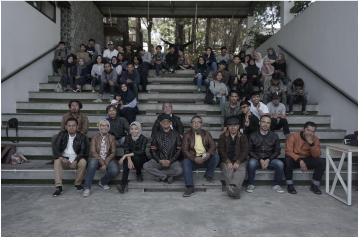
Gambar 15. Suasana Designer Talks

Penyuluhan diikuti oleh 90 orang peserta. Disediakan makanan ringan beserta minuman yang bisa disantap di tengah acara, sehingga acara berlangsung cukup santai dan menyenangkan. Bagi Selain anggota HDII, beberapa peserta umum dari lingkup arsitektur dan interior juga hadir karena acara juga terbuka untuk umum.