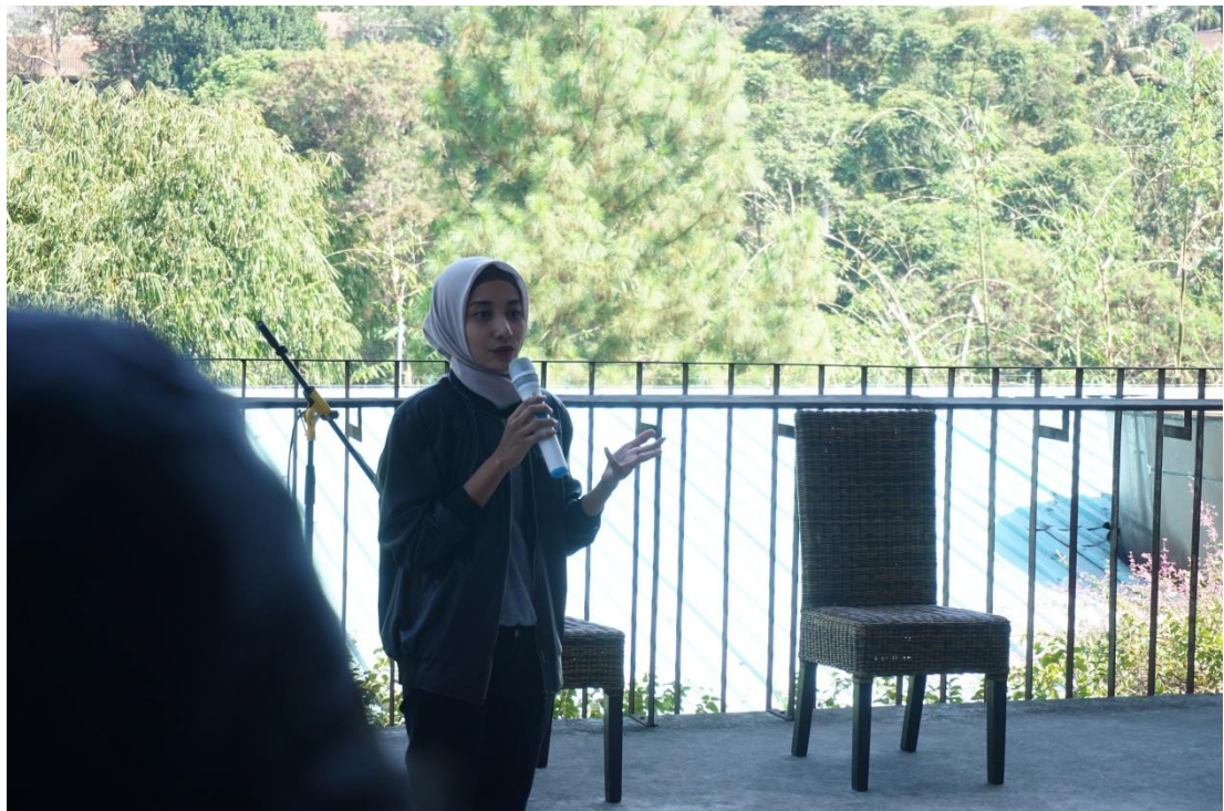
Gambar 3. Suasana Designer Talks (Narasumber)