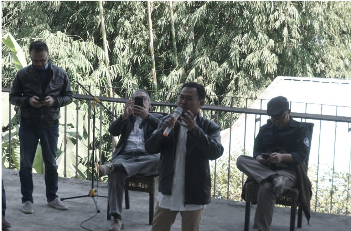
Gambar 9. Suasana Designer Talks (Narasumber)