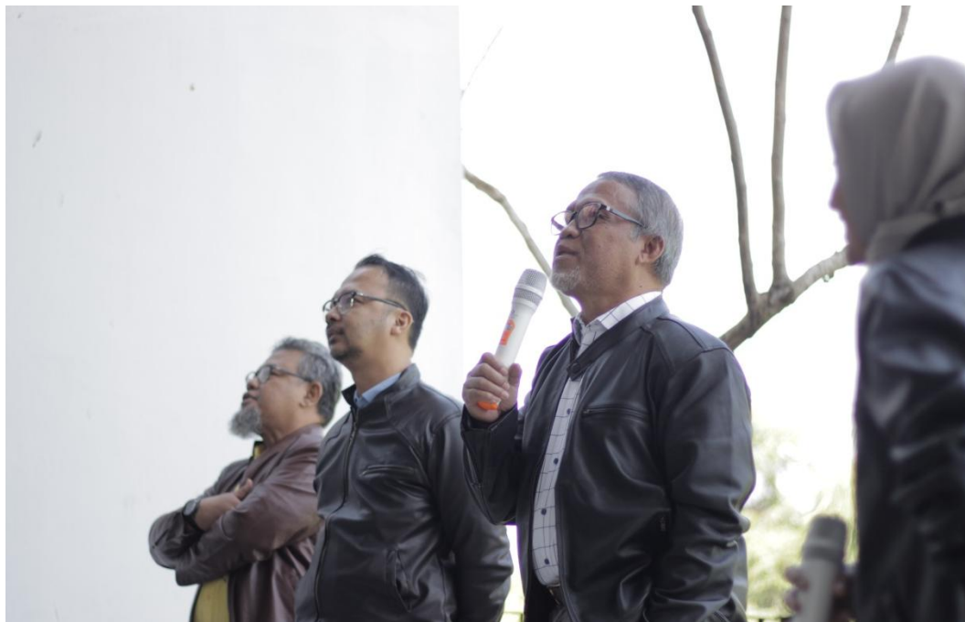
Gambar 14. Suasana Designer Talks (narasumber)