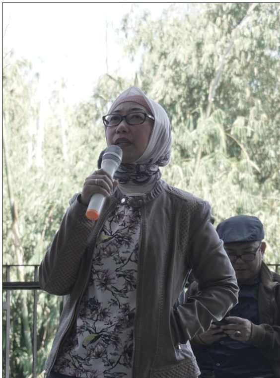
Gambar 11. Suasana Designer Talks (Narasumber)