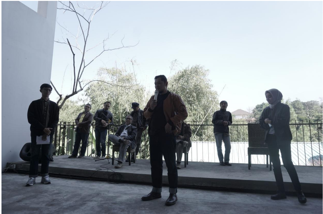
Gambar 2. Suasana Designer Talks (beberapa Narasumber)