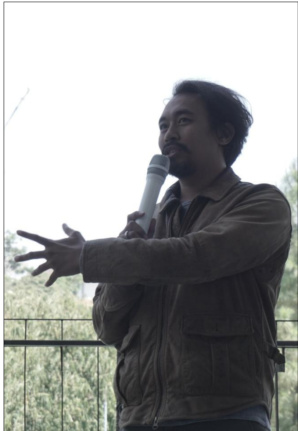
Gambar 4. Suasana Designer Talks (Narasumber)