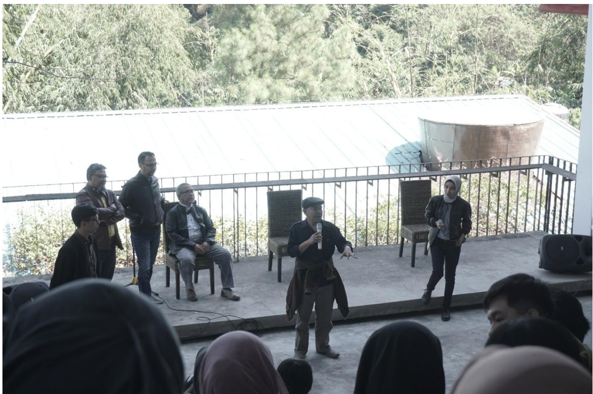
Gambar 8. Suasana Designer Talks (Narasumber)