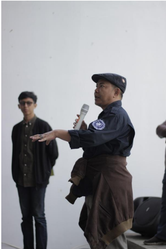
Gambar 12. Suasana Designer Talks (narasumber)