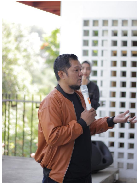
Gambar 10. Suasana Designer Talks (Narasumber)