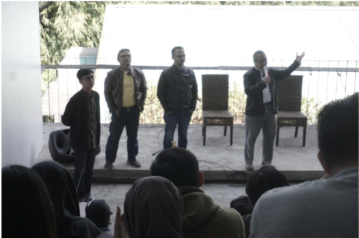
Gambar 7. Suasana Designer Talks (Narasumber)