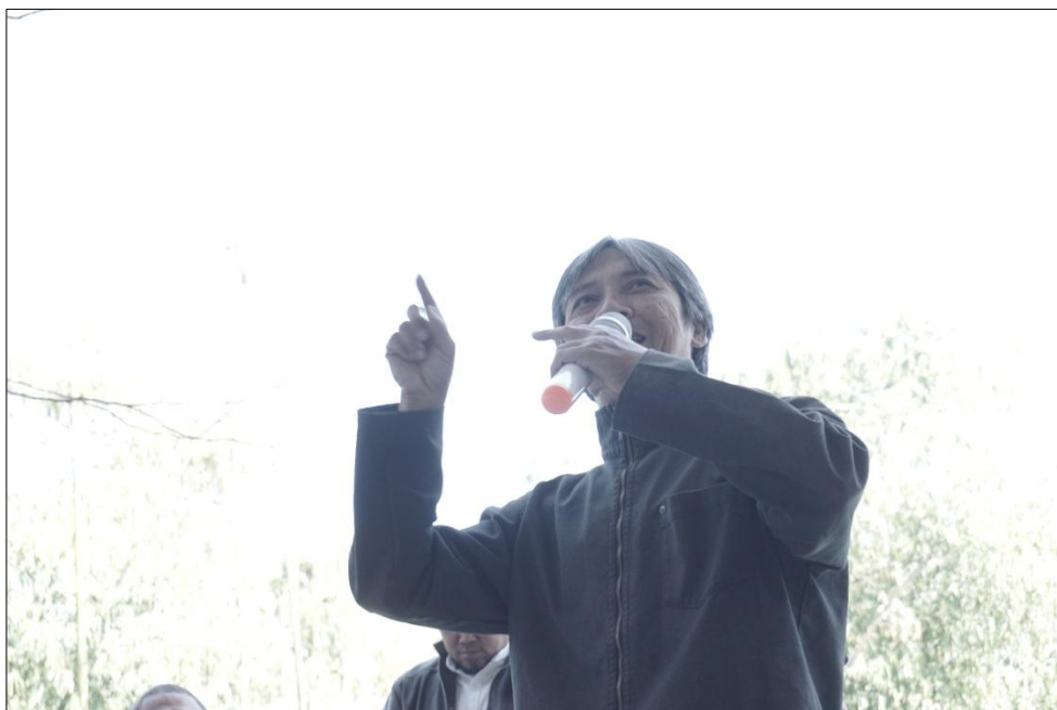
Gambar 6. Suasana Designer Talks (Narasumber)