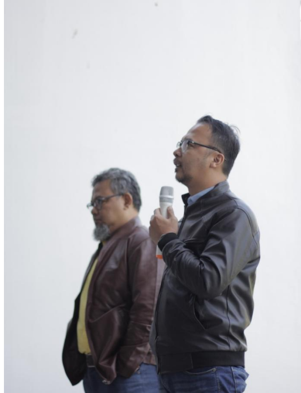
Gambar 13. Suasana Designer Talks (narasumber)