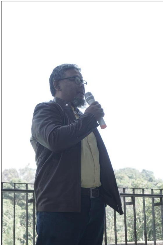
Gambar 5. Suasana Designer Talks (Narasumber)