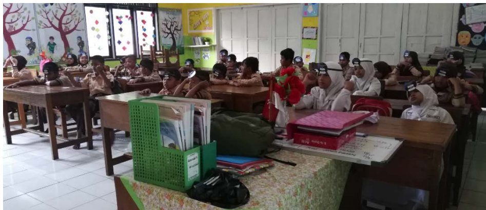
Gambar 11 Suasana Pengajaran Kelas 3A

Gambar Berikut merupakan Sesi Pengajaran Di Kelas 3A dimana penulis sedang mengajar