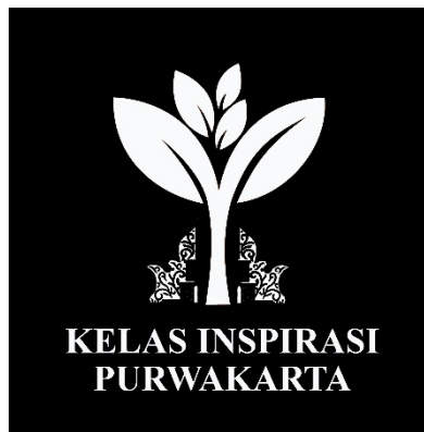
Gambar 1 Logo Kelas Inspirasi Purwakarta