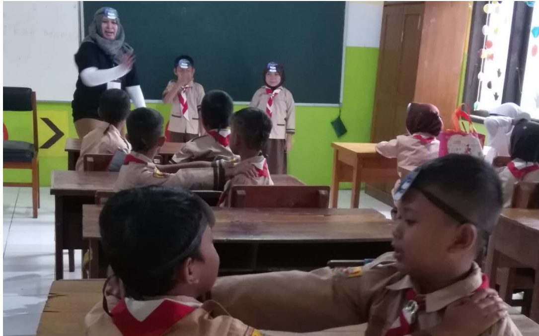
Gambar 3. Pemasangan Pohon cita-cita

menit. Penulis memulai dengan membagikan pohon cita-cita yang harus ditulis kemudian dipasang pada kepala seperti gambar berikut ini :