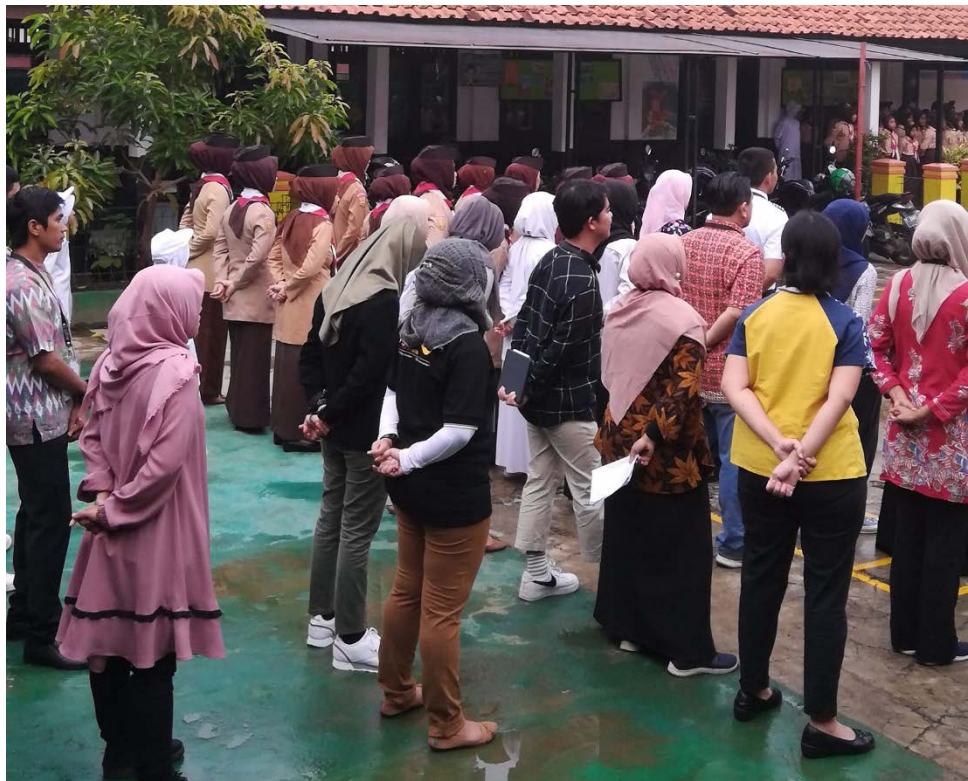
Gambar 9 Sesi upacara relawan