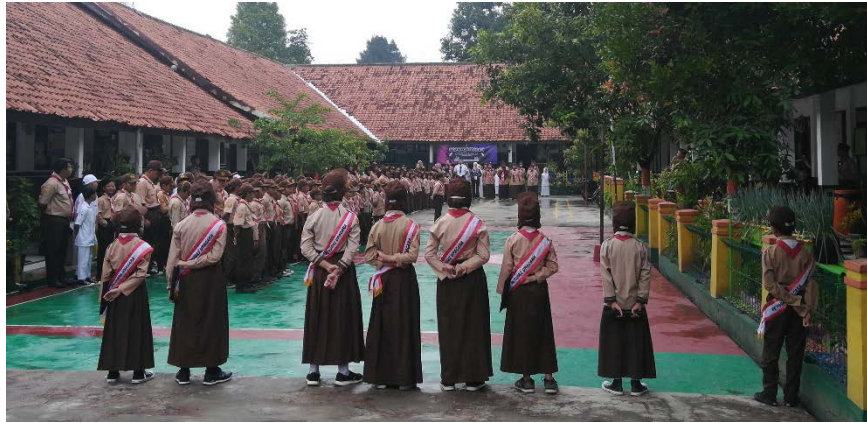
Gambar 8 Sesi Upacara SD Pasawahan Kidul