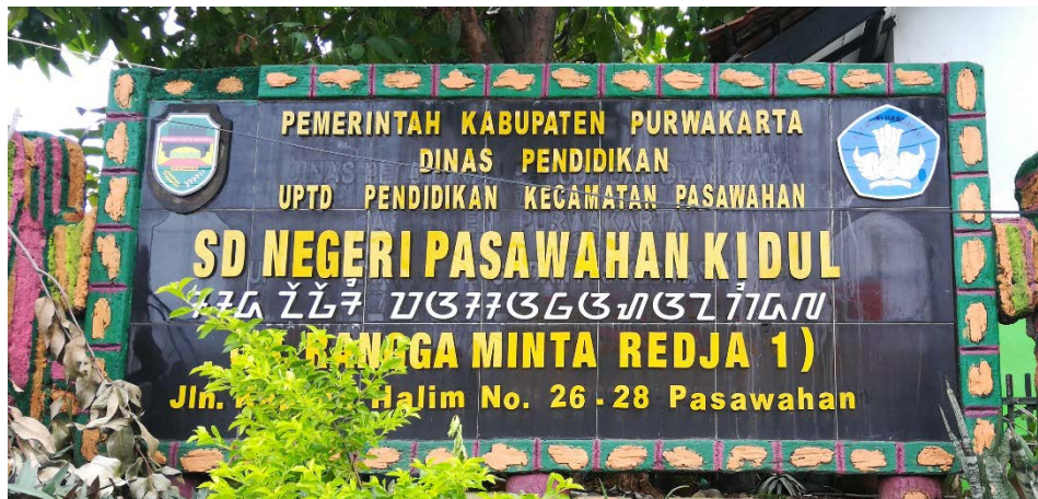
Gambar 7 Plang Nama SD Pasawahan Kidul

8.2 Gambar 7 merupakan plang nama tembok SD Pasawahan Kidul sebagai acuan lokasi