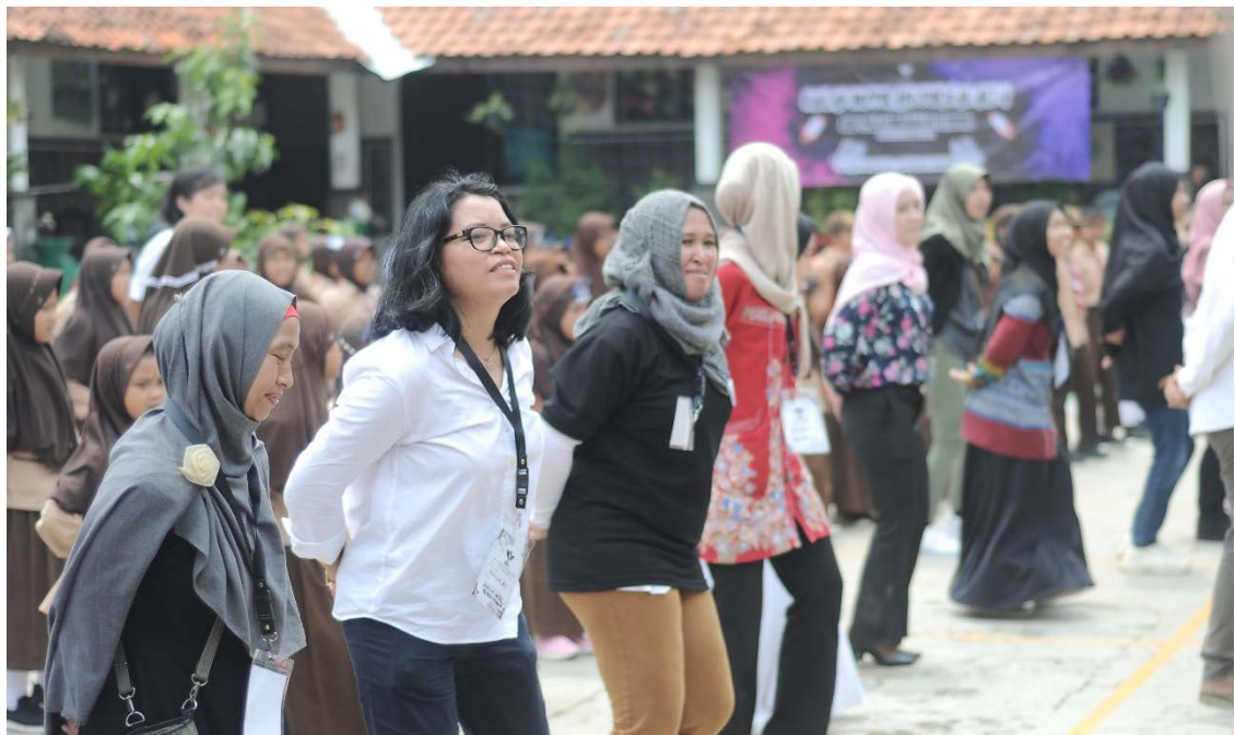
Gambar 4 Flashmob sherina yang diikuti oleh seluruh siswa, guru dan relawan

Selesai mengajar dua kelas sesuai jadwal maka acara dilanjutkan dengan closing oleh seluruh siswa, guru dan anak SD di lapangan upacara. Seluruh relawan memandu untuk melakukan gerakan flasmob sherina sambil diiringi musik sherina (Gambar 4) . Acara ditutup dengan pemberian sertifikat untuk pihak sekolah dan ramah tamah.