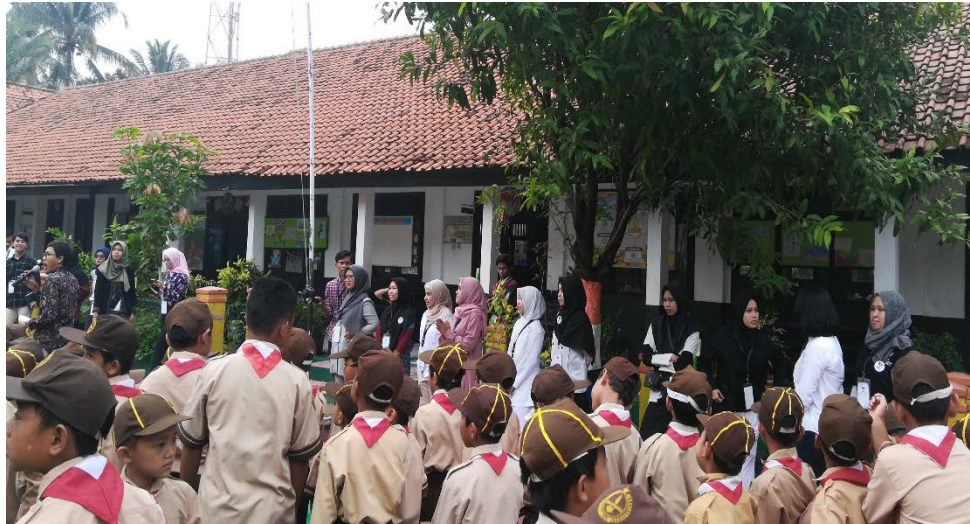
Gambar 10 Sesi Perkenalan Seluruh Relawan (penulis : paling kanan)