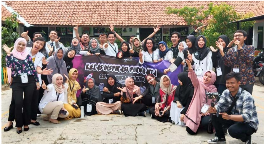
Gambar 16 Foto Bersama Seluruh Tim Relawan Pasawahan Kidul