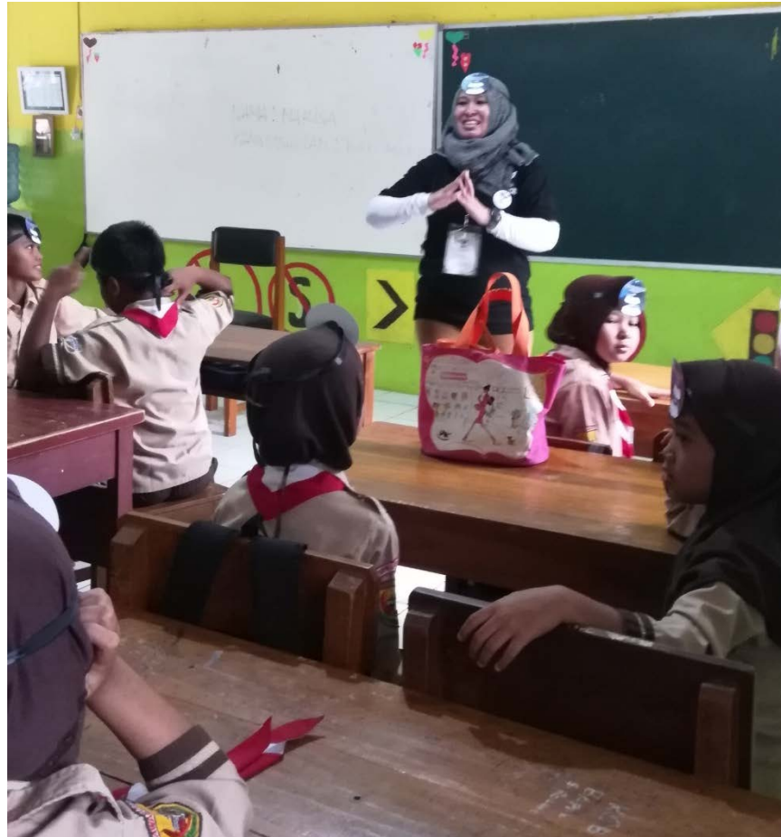
Gambar 12 Suasana Pengajaran Kelas 3A