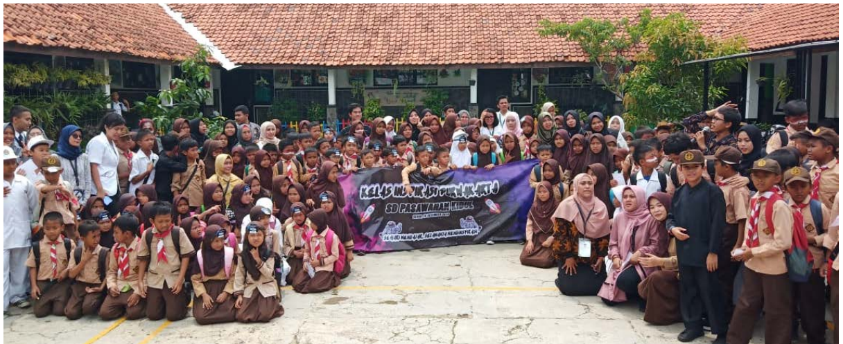
Gambar 17. Foto Bersama Siswa dan Relawan