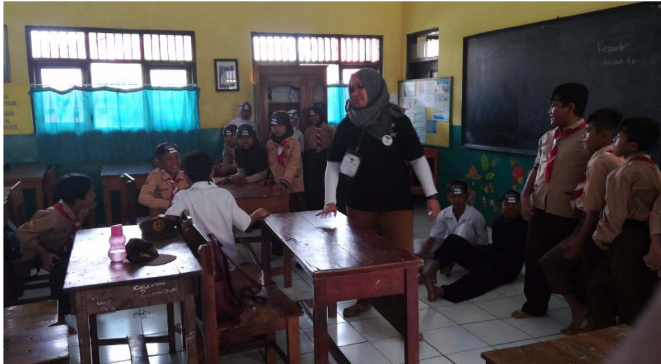
Gambar 14 Suasana Pengajaran Di Kelas 5A