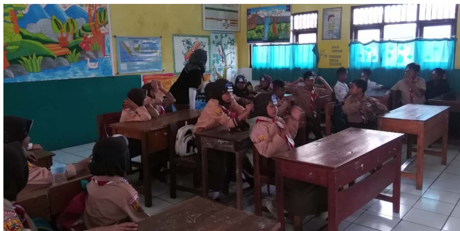
Gambar 13 Suasana Pengajaran di Kelas 5A

Gambar berikut merupakan suanan pengajaran di kelas 5A dimana penulis sedang mengajar