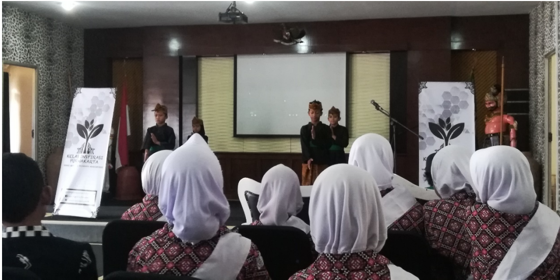
Gambar 6 Pentas Seni Pencak Silat SD Pasawahan Kidul

8.1 Gambar 6 merupakan Salah Satu Kegiatan Briefing dimana SD Pasawahan Kidul mempersembahkan Pentas Seni Pencak Silat