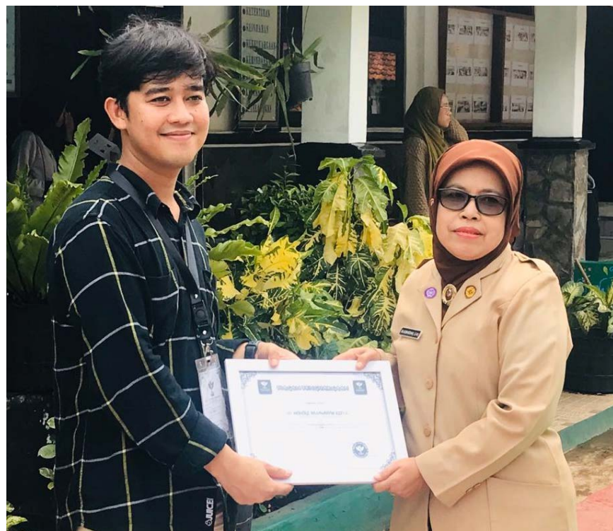
Gambar 15 Pemberian Sertifikat Penghargaan oleh Ketua Tim Relawan Pasawahan Kidul

Closing ditutup dengan flashmob Sherina, Pemberian Sertifikat dan Foto Bersama