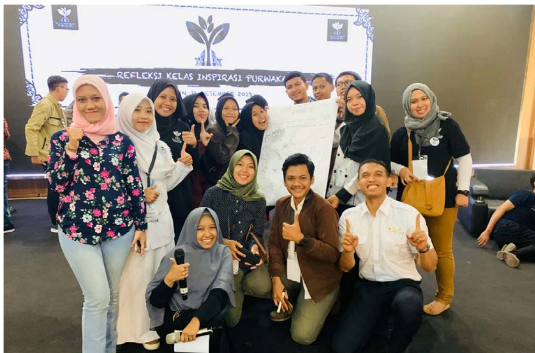
Gambar 5 Presentasi hasil pengajaran pada sesi refleksi