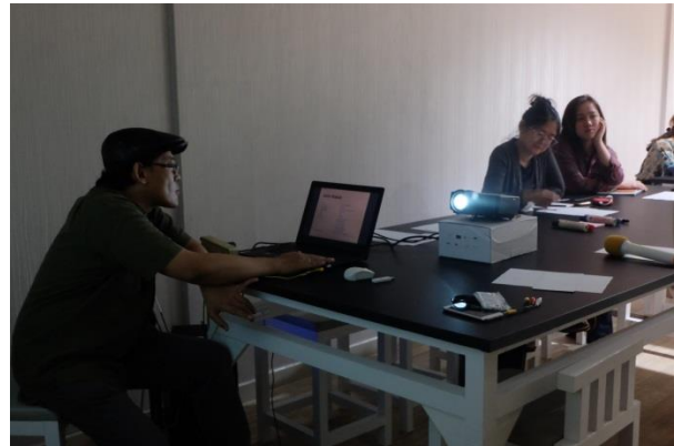
Pembukaan kegiatan TOT