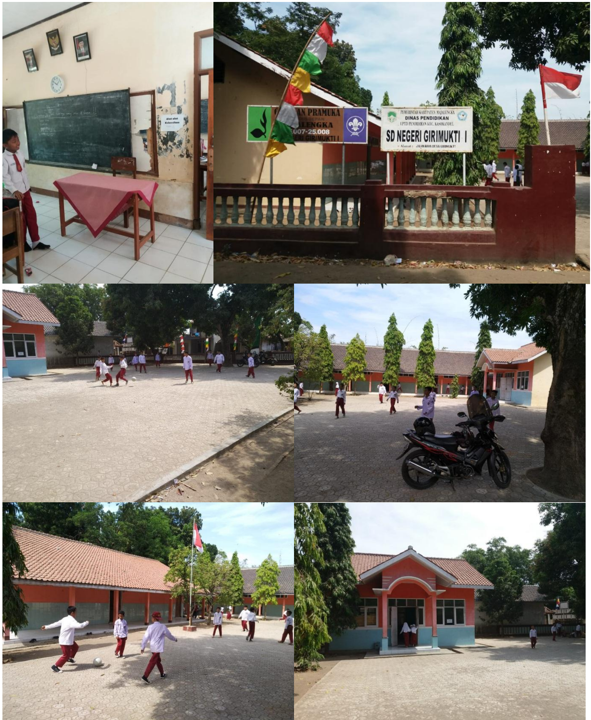
Survey ke lokasi sekolah SDN Girimukti 1

Dari survey yang dilakukan terdapat data yang bisa diambil :