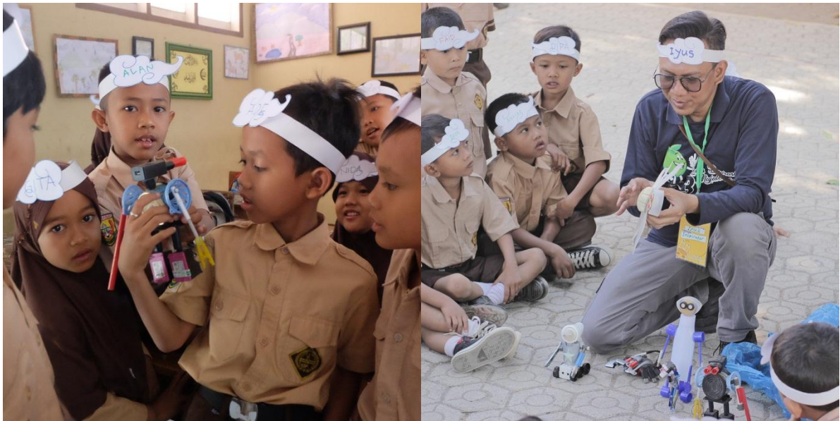
Memperkenalkan prinsip 'manfaatkan yang ada', bahwa membuat karya tidak harus mahal, bahan-bahannya bisa dari sampah yang kita jumpai di sekitar mereka