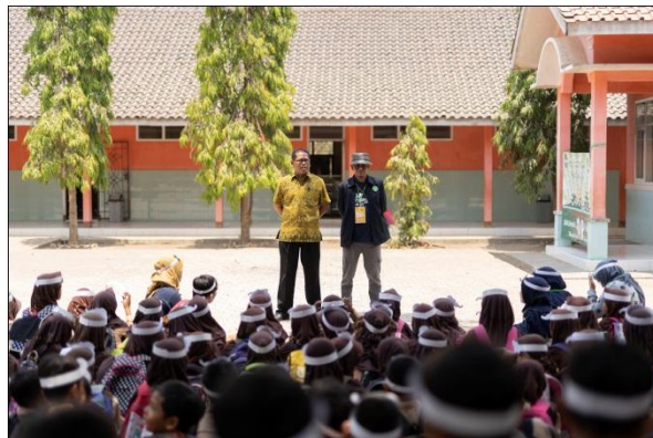
Suasana closing sebelum siswa SD bubar.