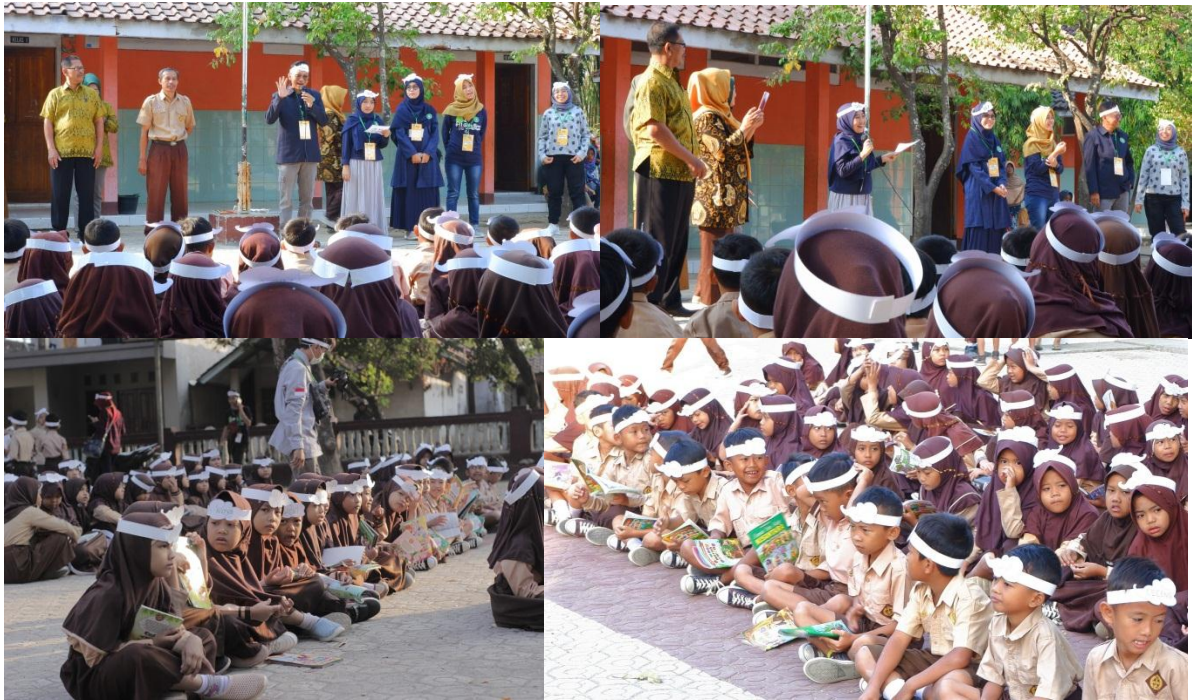
Suasana Opening Kelas Inspirasi Majalengka #3 kelompok Girimukti 1

Hari Inspirasi merupakan hari di mana waktu pelaksanaan seluruh kelompok menyampaikan inspirasi kelas berupa materi profesi nya masing-masing kepada anak-anak SD yang ditempatkan. Pada hari Sabtu , 14 September 2019, seluruh Hari Inspirasi “Kelas Inspirasi Majalengka #3” serentak dilaksanakan. Di SDN Girimukti 1 tempat hari insiprasi dilaksanakan tercatat sebanyak 157 siswa yang hadir di acara ini.