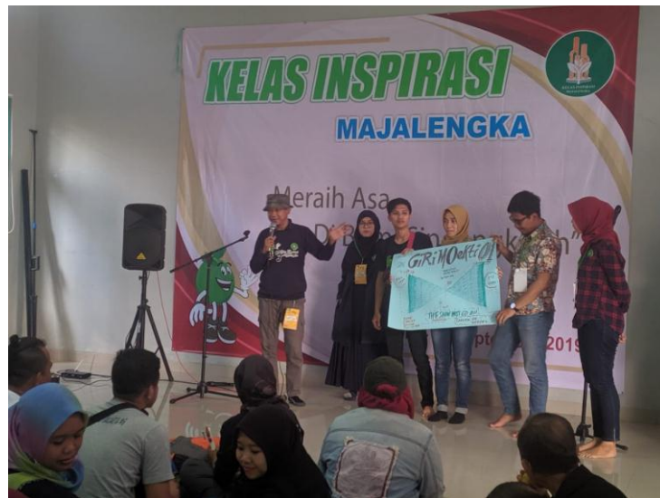
presentasi 'Refleksi' kelompok di depan rekan rekan sesama relawan dan panitia.