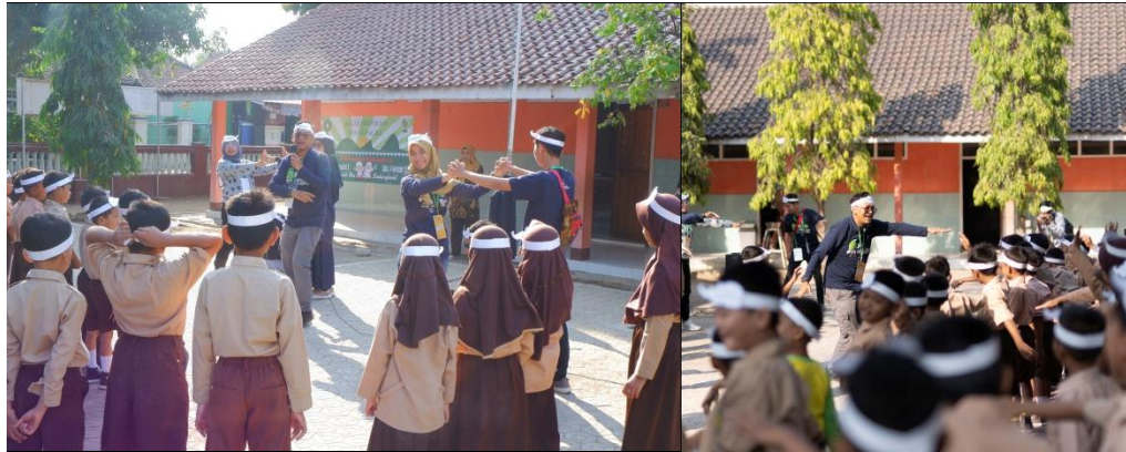
Ice Breaking dan penciptaan suasana sebelum masuk kelas perlu dilakukan untuk memudahkan kita mencairkan suasana dan memecah kebekuan saat memasuki kelas.