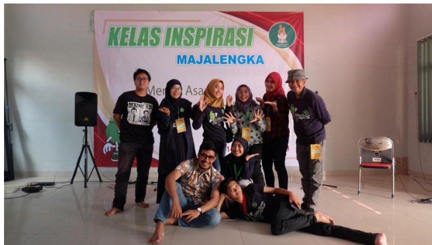
Foto bersama per kelompok Relawan KI Majalengkas SDN Girmukti 1 di kegiatan Refleksi

Kegiatan refleksi merupakan kegiatan yang dilakukan setelah pelaksanaan hari inspirasi sebagai evaluasi dan jang sharing kegiatan yang telah dilakukan baik antar individu relawan juga antar kelompok. Refleksi dilakukan dua jam setelah kegiatan hari inspirasi berlangsung bersama seluruh relawan baik relawan , fasilitator dan panitia penyelenggara. Kegiatan dilakukan di Gedung Serbaguna Dinas Sosial Kabupaten Majalengka Jl. Raya K H Abdul Halim No.499, Tonjong, Kec. Majalengka, Kabupaten Majalengka.