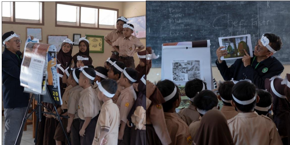
Memperkenalkan profesi dosen dan desainer kepada siswa siswi SD serta menanyakan apa cita cita mereka merupakan tantangan tersendiri