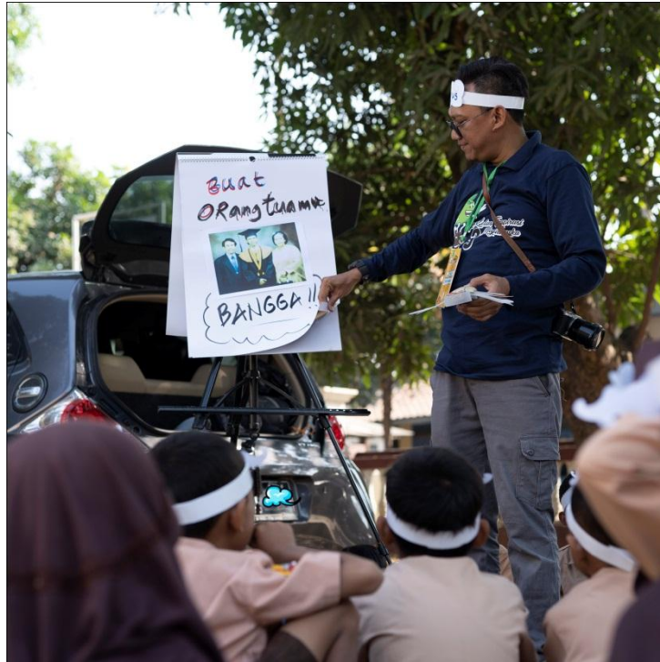
Pemberian materi dan games untuk siswa kls 1 & 2 lebih efektif dan seru ketika dilakukan di luar kelas.