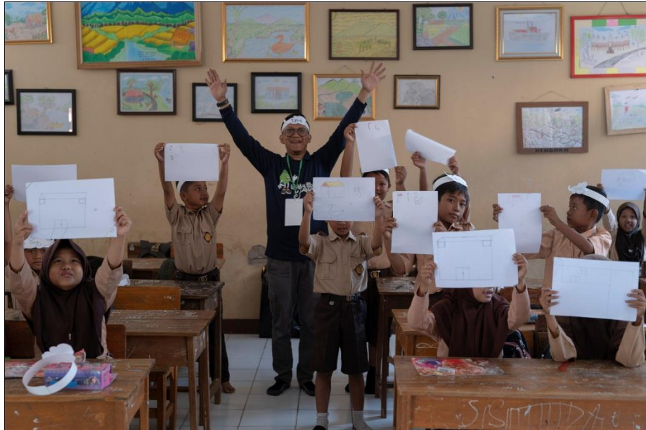
Hasil workshop kecil-kecilan di Kelas Inspirasi bakat menggambar anak-anak sudah terlihat