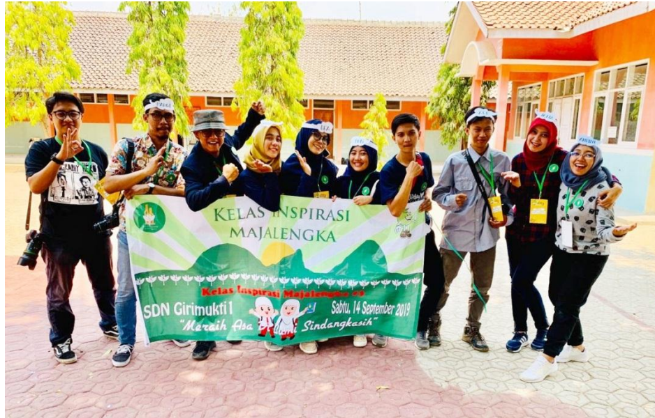
Foto bersama Team Relawan KI Majalengkas SDN Girmukti 1