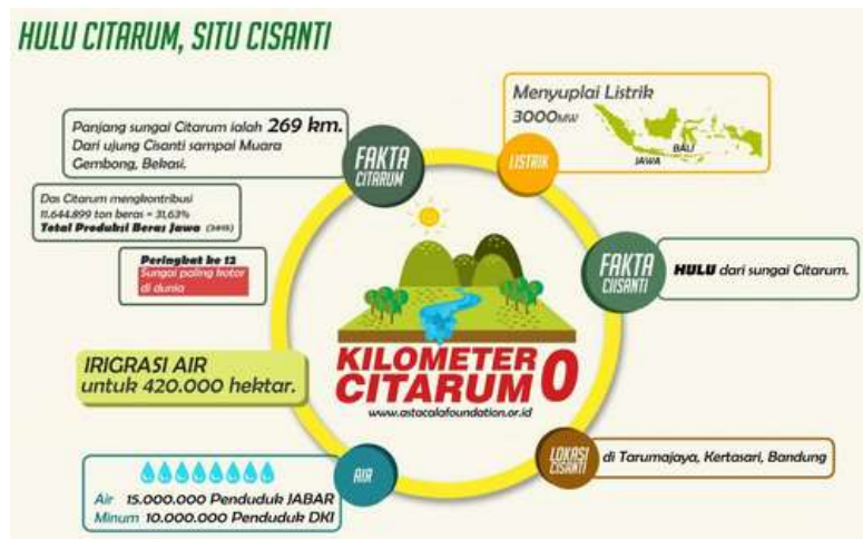
Gambar 2. Hulu Citarum, Situ Cisanti