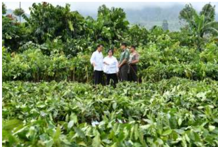
Gambar 6. Presiden Joko Widodo di DAS Citarum

Presiden Joko Widodo menyadari revitalisasi Daerah Aliran Sungai (DAS) Citarum bukanlah pekerjaan mudah yang dapat diselesaikan hanya dalam hitungan hari, bulan, bahkan 1 atau 2 tahun.