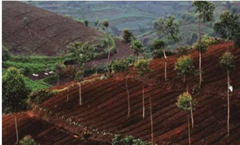
Gambar 3. Lahan kritis di hulu Sungai Citarum