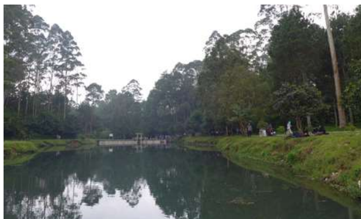
Gambar 4. Pencemaran di kawasan hulu

Bukan hanya menyelamatkan 25 juta jiwa masyarakat yang menggantungkan kehidupnya pada Citarum, namun penyelamatan kawasan hulu juga harus tetap mempertimbangkan keterpaduan ekonomi dan lingkungan untuk pengelolaan kawasan hulu Citarum. Peningkatan kesejahteraan masyarakat menjadi mutlak, jika mata pencahariannya sehat maka lingkunganpun akan selamat.