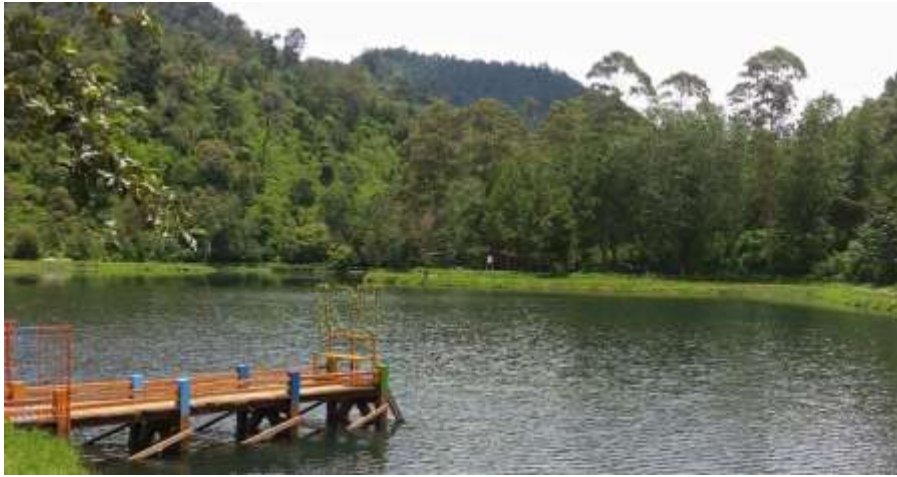
Gambar 5. Dermaga Situ Cisanti