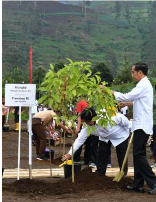
Gambar 7. Presiden Joko Widodo melakukan penanaman pohon di DAS Citarum