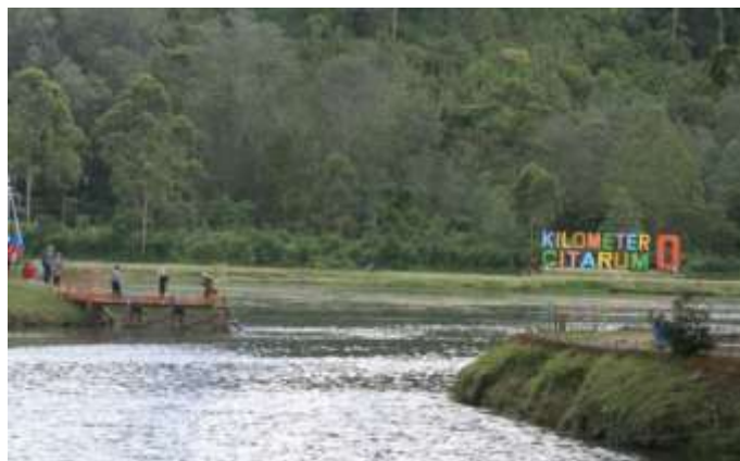
Gambar 1. Situ Cisanti (Kilometer 0 Citarum)

Situ/danau Cisanti merupakan titik nol atau hulu sungai citarum, salah satu sungai terbesar di Jawa Barat yang dikenal dengan polusinya. Sungai citarum yang kotor berawal dari tempat yang begitu bersih dan indah. Kawasan Danau Cisanti dikelilingi oleh beberapa gunung seperti Gunung Wayang, Gunung Malabar, Gunung Bedil, dan Gunung Rakutak. Lokasinya juga tidak begitu jauh dari kawasan perkebunan teh Pangalengan.