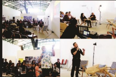
Bale Tonggoh, Selasar Sunaryo Art Space Sabtu, 24 Nov 2016

Link untuk dokumentasi lengkap --> http://tiny.cc/6ggz4y