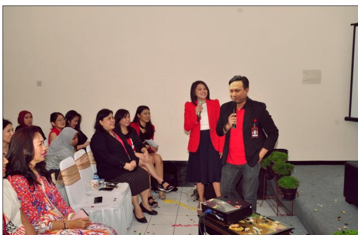
Penjelasan kurikulum kepada calon siswa