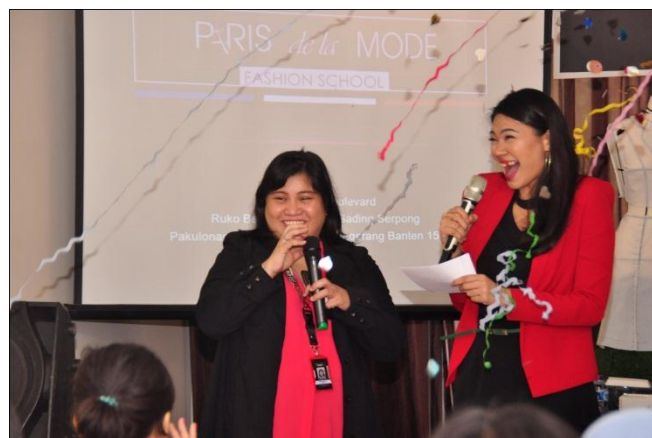
Pembukaan oleh Owner PT. Desain Global Internasional