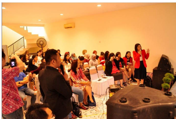
Sosialisasi kurikulum kepada calon siswa