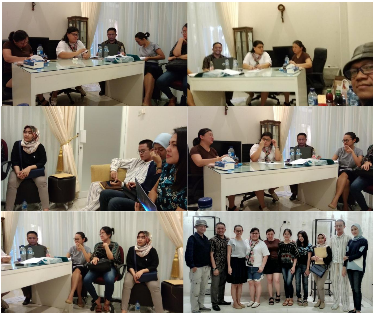
Workshop penyusunan dan penetapan kurikulum

Kegiatan penyusunan kurikulum secara langsung dilakukan tanggal 29 November 2018 melibatkan 10 orang yang terdiri dari Pemilik, calon instruktur dan staf ahli penyusunan Kurikulum yang diminta pihak Paris dela Mode. Penyusunan kurikulum berlangsung satu hari karena sebelumnya sudah mempunyai draft dari hasil briefing dan diskusi lewat media medsos Whatsapp.