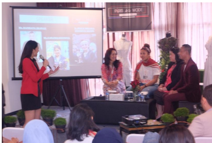
Talkshow tentang dunia fashion di Indonesia