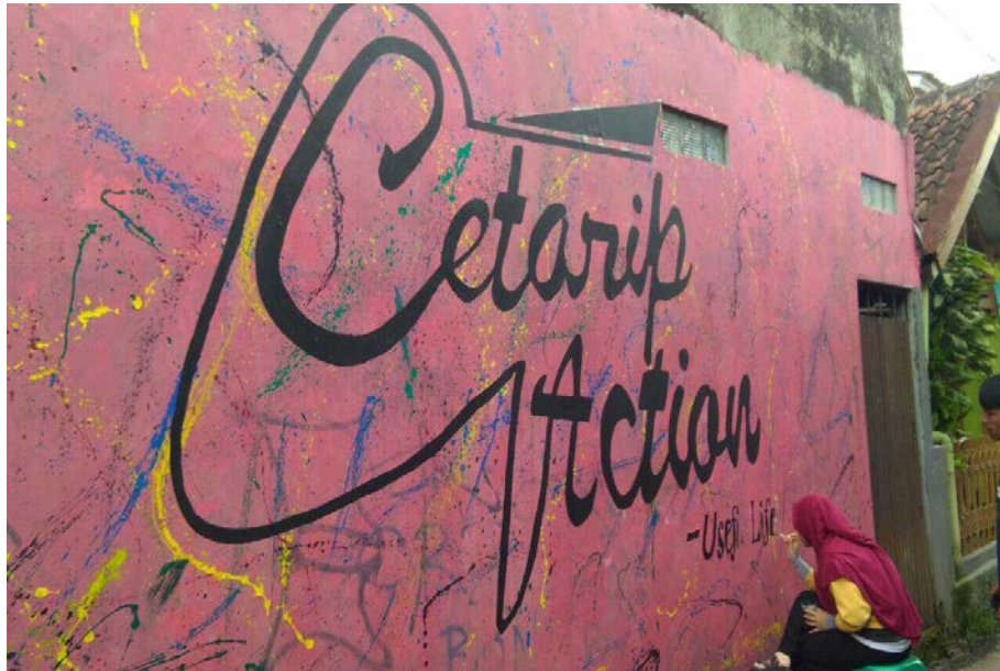
Gambar 7. Hasil Pengecatan Warga Cetarip