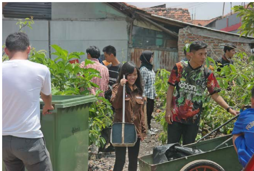
Gambar 4. Gerakan Pungut Sampah Bersama Warga