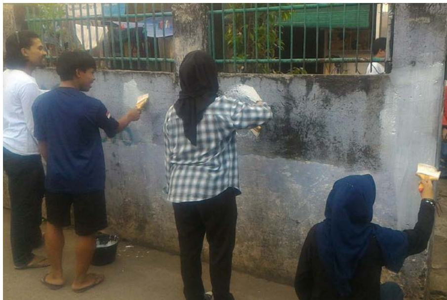
Gambar 6. Proses pengecatan tembok