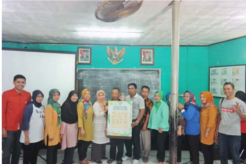
Gambar. 3 Penandatanganan Komitmen Bersama Mewujudkan Cetarip Bebas Sampah.