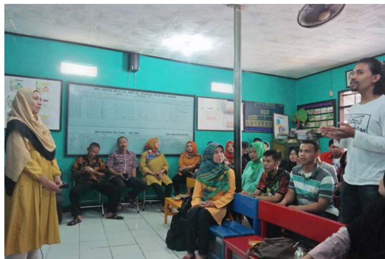
Gambar 2. Sesi Diskusi Antara Tim Pengajar Dengan Warga RW07