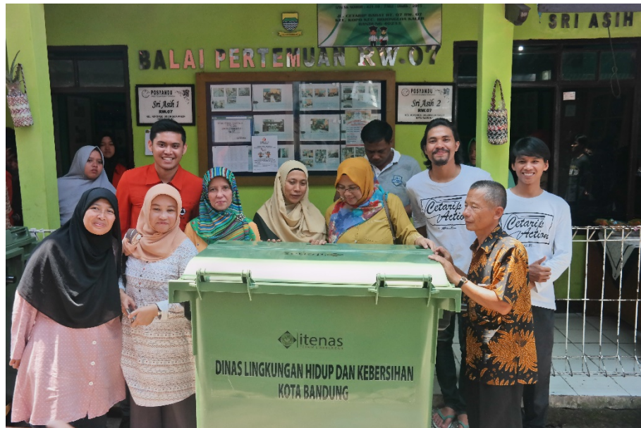
Gambar 5. Serah Terima Sarana Prasarana