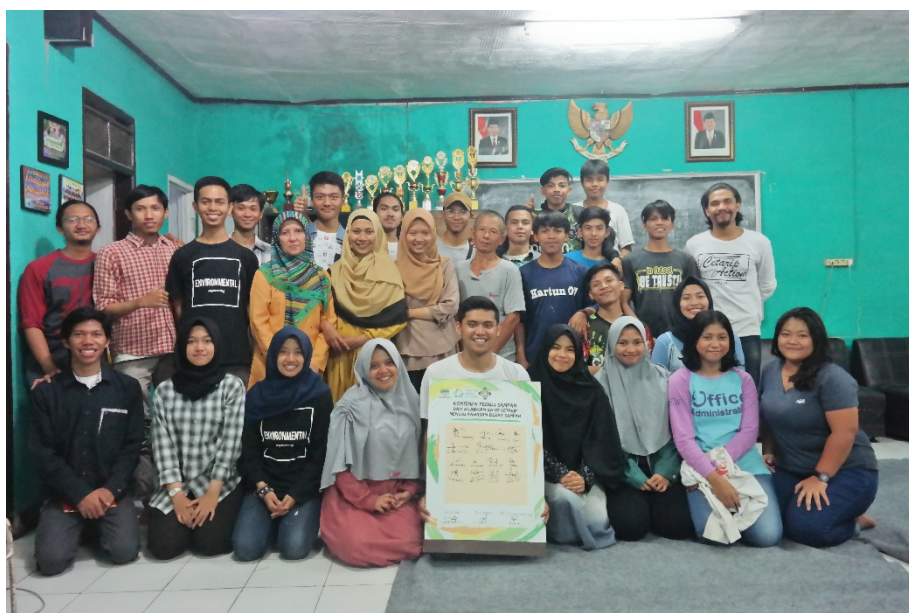
Gambar 8. Foto Bersama Setelah Kegiatan