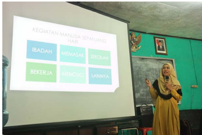
Gambar 1. Pemaparan Materi Oleh Dosen Teknik Lingkungan Itenas

Foto- foto kegiatan penyuluhan dan kegiatan bersama disampaikan dibawah ini.