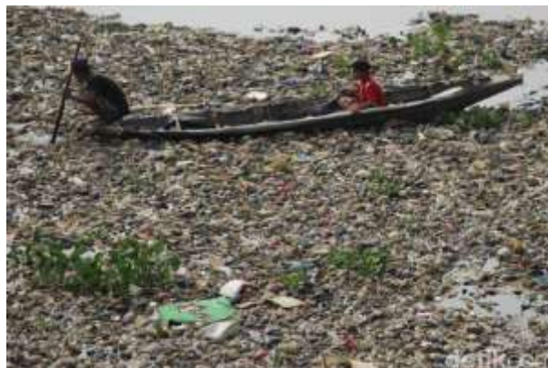
Gambar 8. Kotornya Sungai Citarum akibat limbah sampah