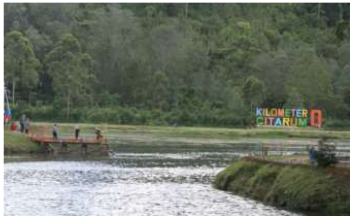
Gambar 1. Situ Cisanti (Kilometer 0 Citarum)

Situ/danau Cisanti merupakan titik nol atau hulu sungai citarum, salah satu sungai terbesar di Jawa Barat yang dikenal dengan polusinya. Sungai citarum yang kotor berawal dari tempat yang begitu bersih dan indah. Kawasan Danau Cisanti dikelilingi oleh beberapa gunung seperti Gunung Wayang, Gunung Malabar, Gunung Bedil, dan Gunung Rakutak. Lokasinya juga tidak begitu jauh dari kawasan perkebunan teh Pangalengan.