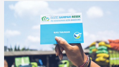
1. Buku Tabungan