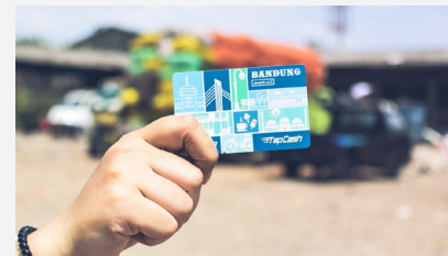
2. Tap Cash