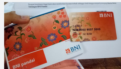
3. Laku Pandai