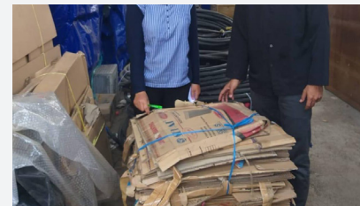
4. Sedekah Sampah