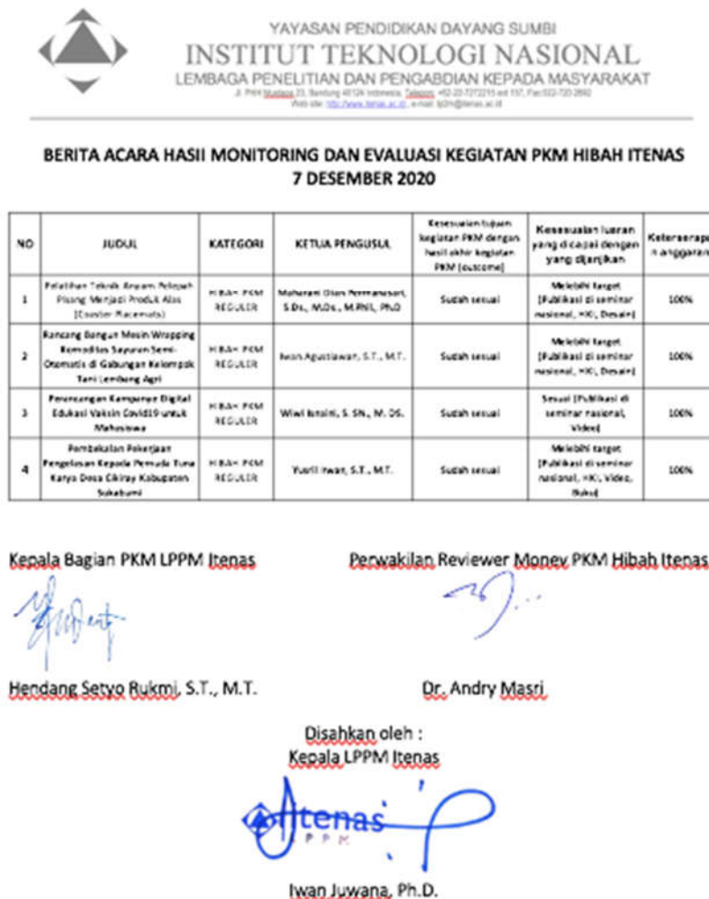
Gambar 6 Berita Acara Monitoring dan Evaluasi

Monitoring dan evaluasi kegiatan PkM dilakukan melalui presentasi laporan kemajuan. Monitoring dan evaluasi dilakukan di awal Desember 2021 melalui presentasi laporan kemajuan. Dalam presentasi laporan kemajuan tersebut reviewer mengevaluasi kesesuaian pelaksanaan PkM dengan proposal, persentase kemajuan dengan tingkat penyerapan dana PkM, dan pencapaian luaran. Setiap kegiatan PkM dinilai oleh 2 orang reviewer yang diangkat berdasarkan SK Rektor. Setiap dosen mendapat surat pemberitahuan jadwal presentasi laporan kemajuan dari LPPM. Hasil monitoring dan evaluasi dituangkan dalam Berita Acara Monitoring dan Evaluasi dan dilaporkan kepada pimpinan LPPM. Berita Acara Monitoring dan Evaluasi dapat dilihat pada Gambar 6