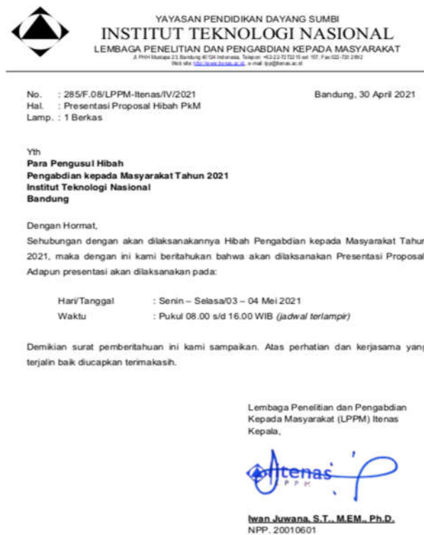
Gambar 2. Surat pemberitahuan presentasi proposal PKM Hibah Itenas

Setiap tim pengusul PKM mempresentasikan proposal PKM yang diusulkan secara online melalui zoom. Pemberitahuan mengenai presentasi proposal PKM dilakukan melalui surat dari LPPM kepada para pengusul hibah seperti terlihat pada Gambar 2. Surat pemberitahuan presentasi disertai jadwal presentasi proposal PKM, seperti terlihat contohnya pada Tabel 3. Jadwal presentasi diumumkan melalui surat dari LPPM kepada setiap ketua Tim Pengusul PKM Hibah Itenas seperti terlihat pada Gambar 2. Setiap Tim Pengusul PKM Hibah Itenas direview oleh 2 orang reviewer.